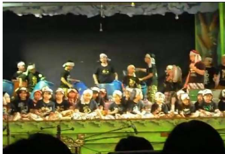
Gambar 47. Penampilan Musik Rangkaian SD Marsudirini acara PAMOR ulang tahun RRI Surakarta