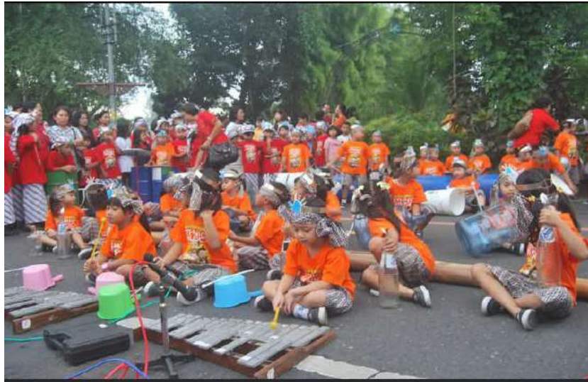
Gambar 46. Penampilan Musik Rangkaian SD Marsudirini pra acara KREASSO di depan Loji Gandrung