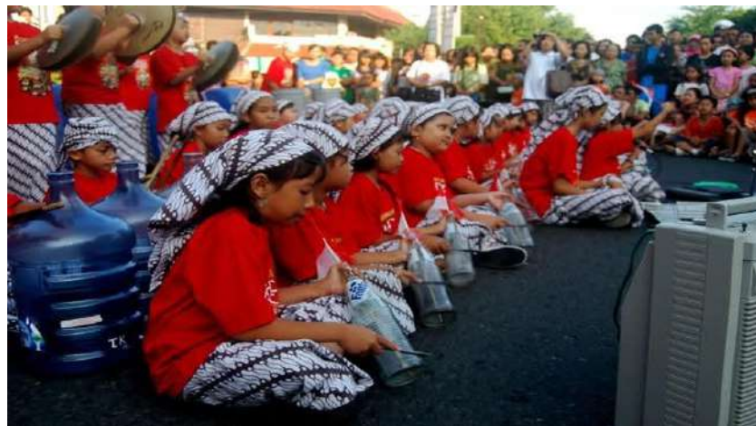
Gambar 45. Penampilan Murid Musik Rangkas SD Marsudirini di HUT CFD yang ke 1