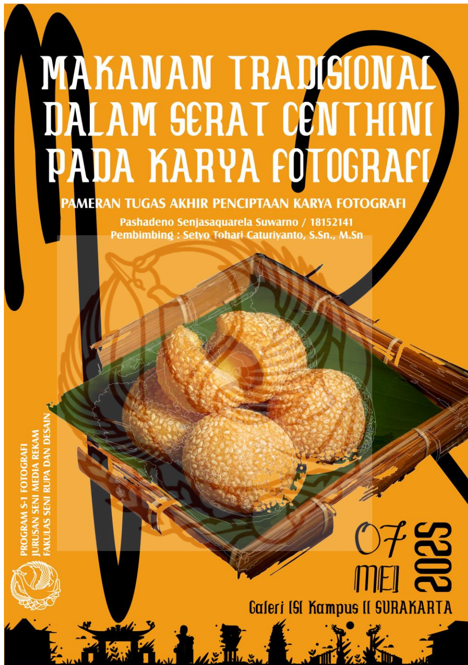
Gambar 46. Poster Pameran Tugas Akhir Karya Foto: Pashadeno Senjaquarela Suwarno , 2025