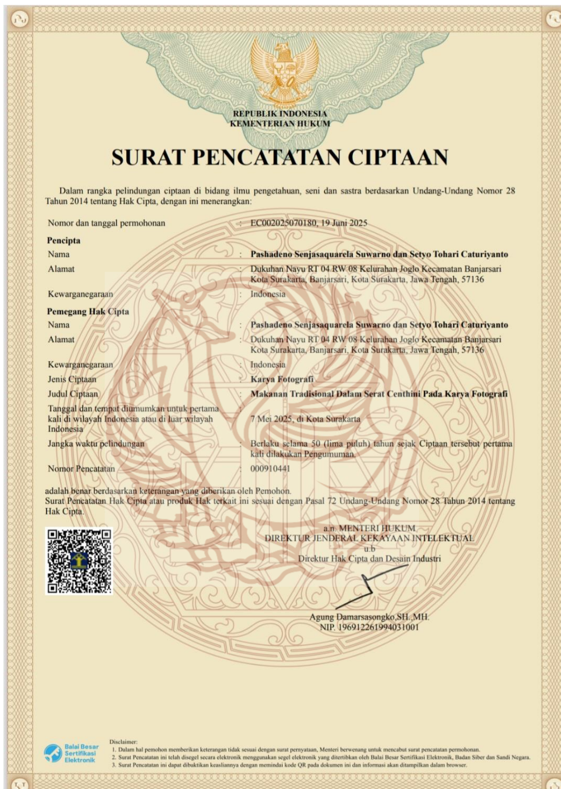
Gambar 54. Surat Penciptaan Ciptaan