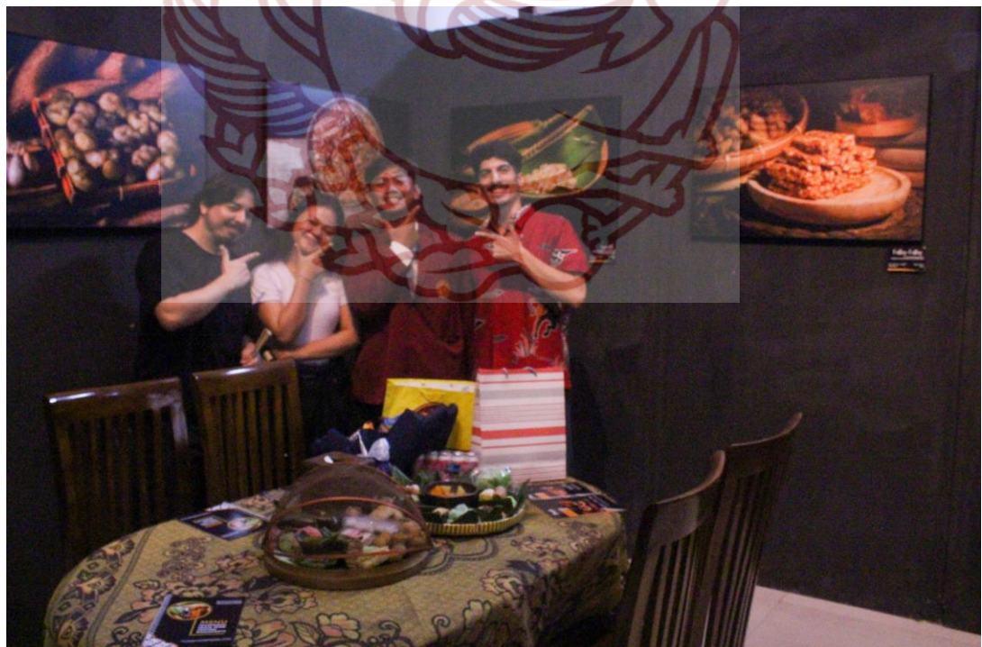
Gambar 51. Foto Bersama Rekan