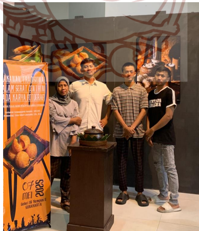
Gambar 53. Foto Bersama Keluarga