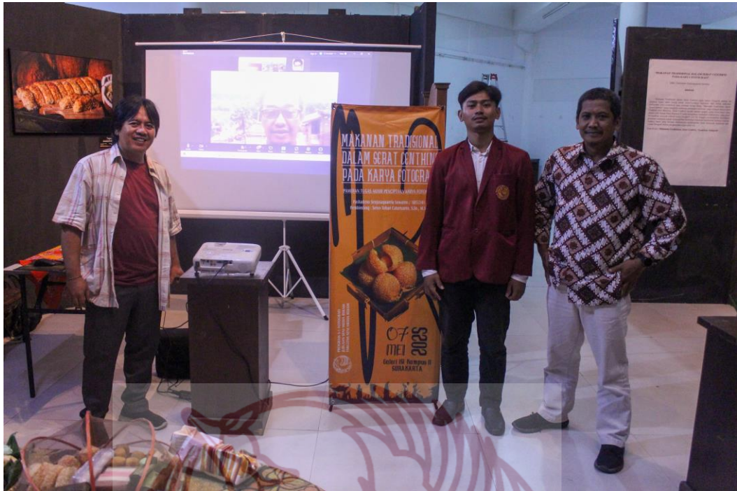
Gambar 48. Foto bersama Dosen Penguji dan Dosen Pembimbing