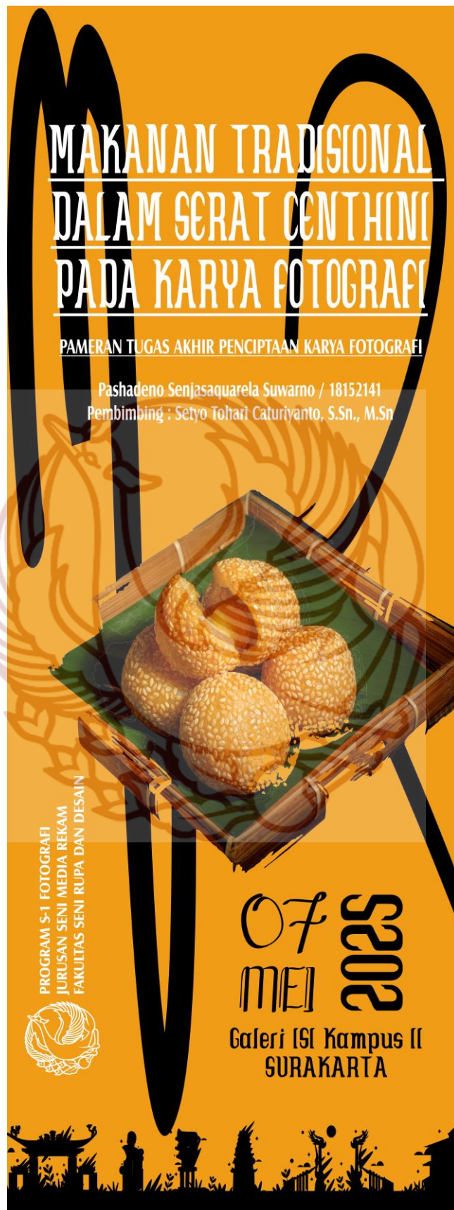
Gambar 47. X-Banner Pameran Tugas Akhir Karya Foto: Pashadeno Senjasaquarela Suwarno 2025