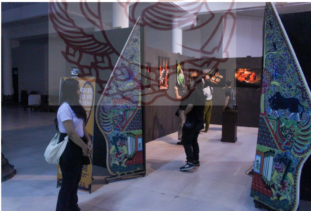
Gambar 49. Ruang Pameran Tugas Akhir Karya Foto: Walter Sebastian , 2025