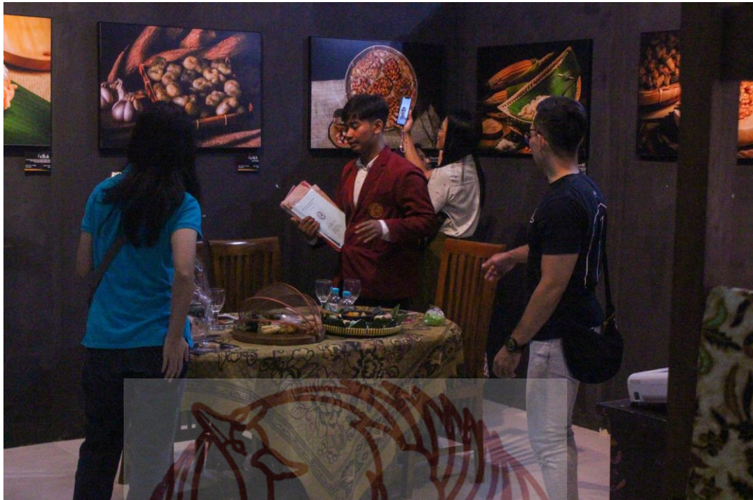
Gambar 50. Suasana Pameran Tugas Akhir Karya.