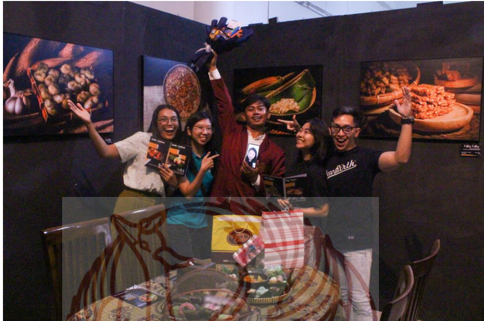
Gambar 52. Foto Bersama Rekan Foto: Walter Sebastian , 2025