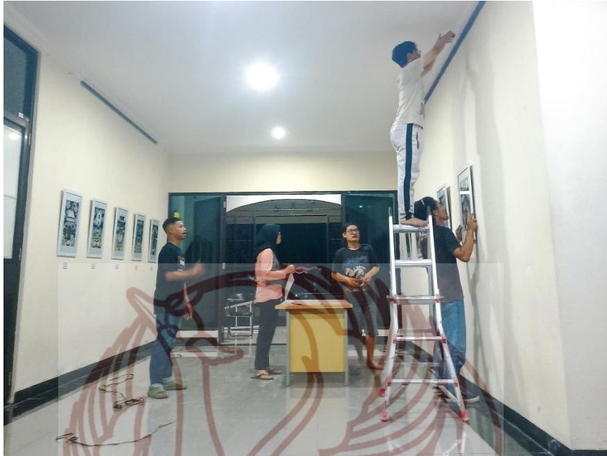
Gambar 55 display karya