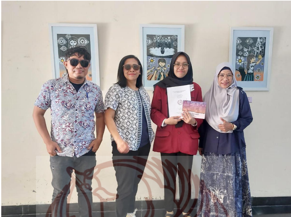
Gambar 57 foto bersama dosen penguji