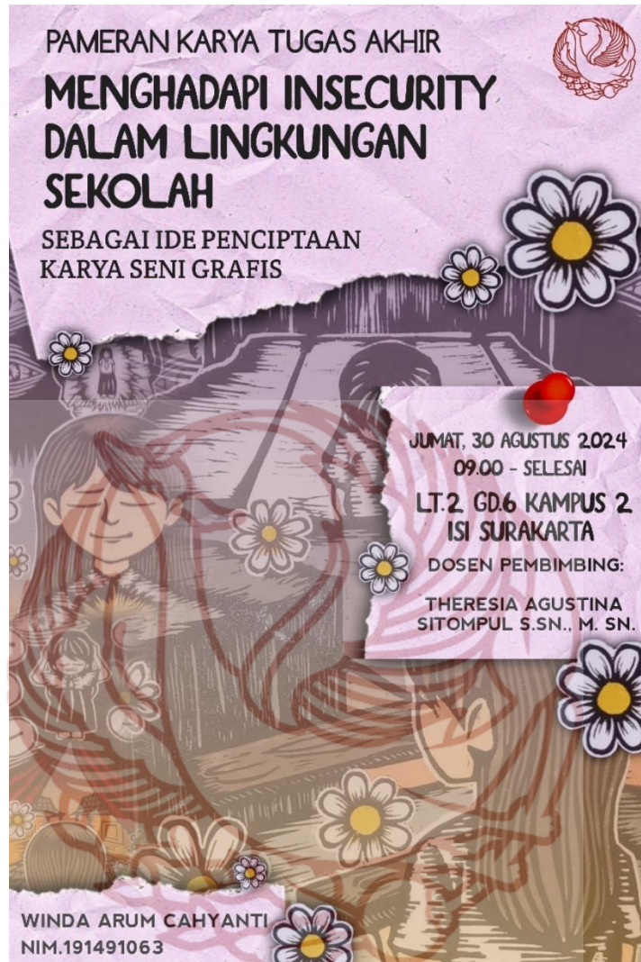
Gambar 53 poster pameran