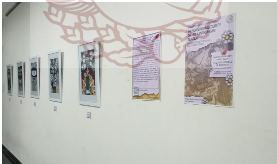
Gambar 56 pameran