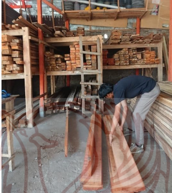
Gambar 86. Proses pemilihan bahan