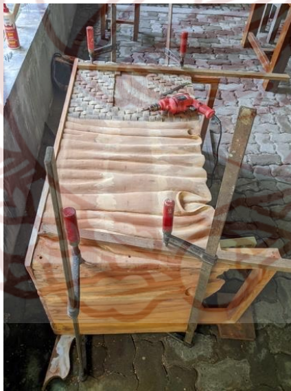
Gambar 89. Perakitan karya