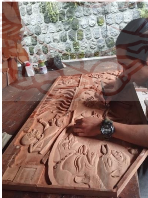
Gambar 87. Proses pemahatan relief