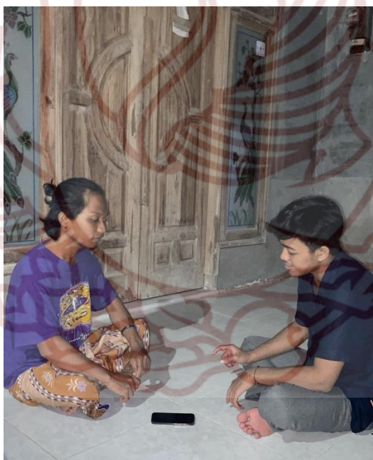
Gambar 83. Wawancara bersama hafidz