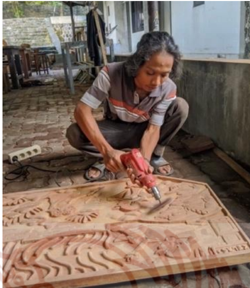
Gambar 88. Proses pengamplasan relief