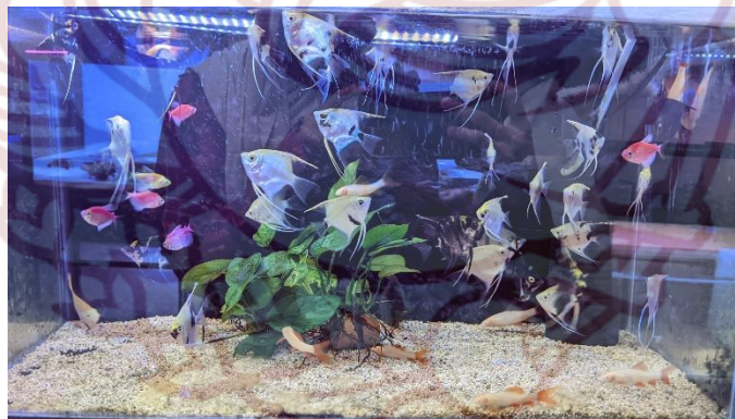
Gambar 85. Ragam ikan di pasar Depok