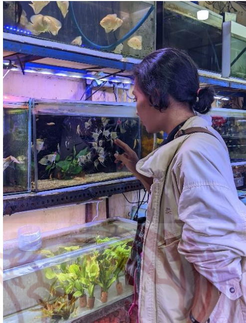
Gambar 84. Observasi di pasar Depok