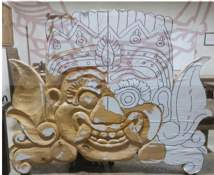
Gambar 88. Pengukiran Kalamakara