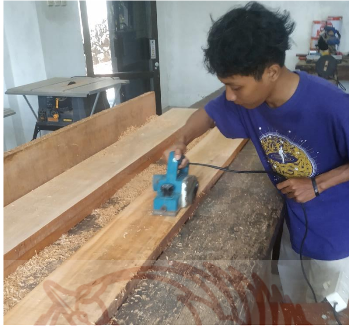
Gambar 83. Ngetam papankayu