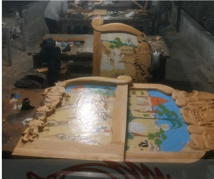
Gambar 85. Proses penyunggingan