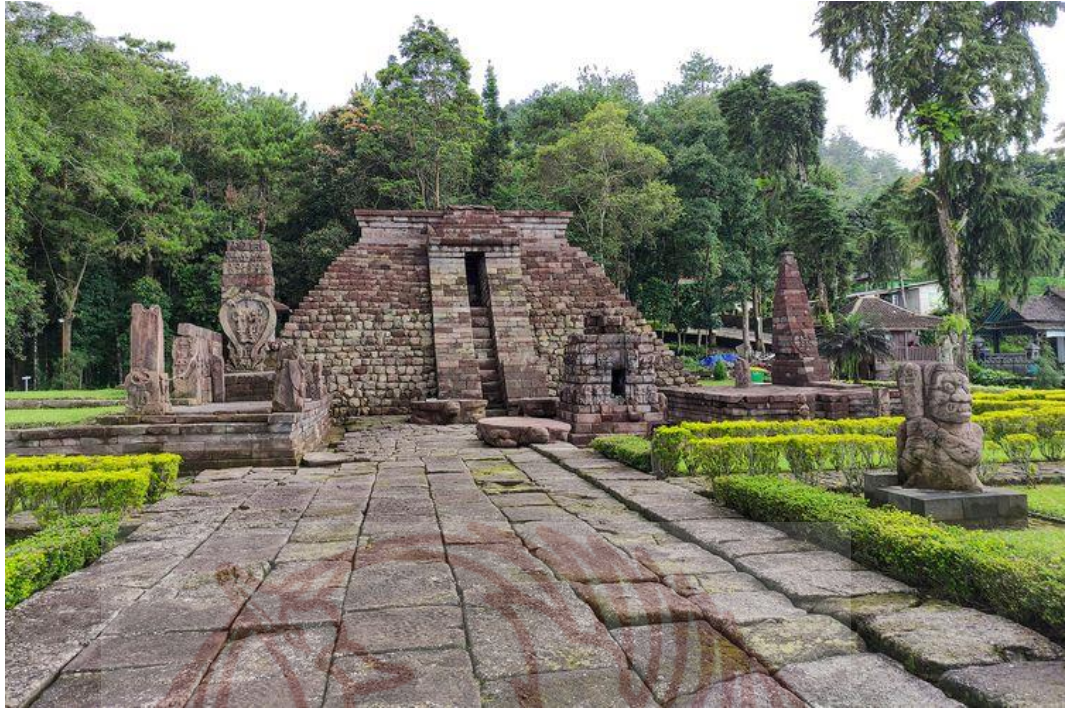
Gambar 81. Candi Sukuh