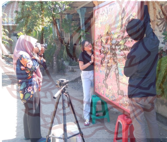
Gambar 80. Mefoto karya Pak Subandi