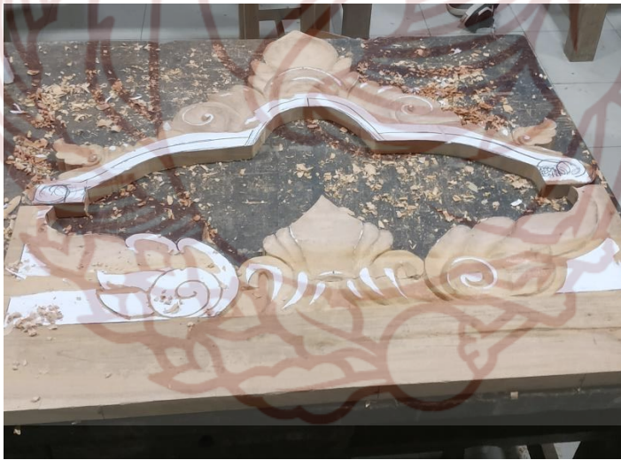
Gambar 84. Proses pengukiran rana