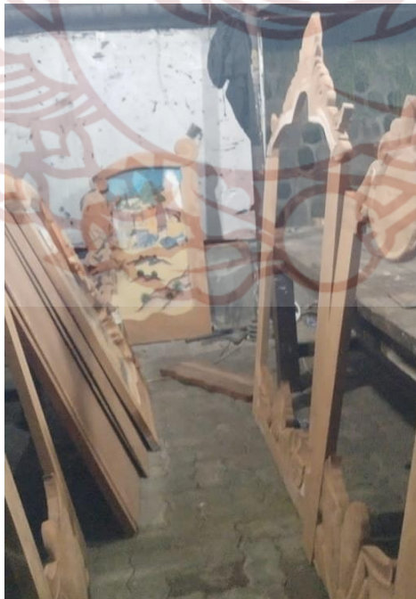
Gambar 86. Merangkai rana