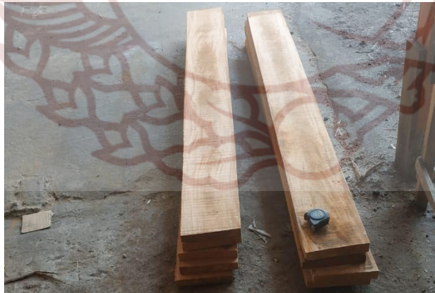
Gambar 82. Pembelian bahan