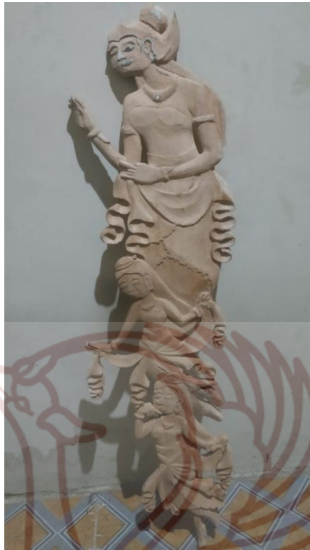
Gambar 87. Pegukiran wayang Beber