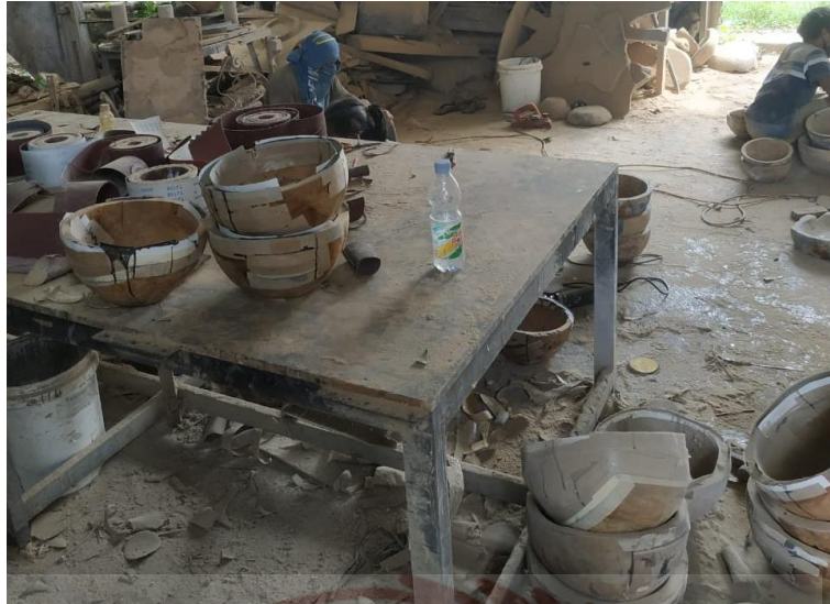
Gambar 79. Opservasi Solo Resin