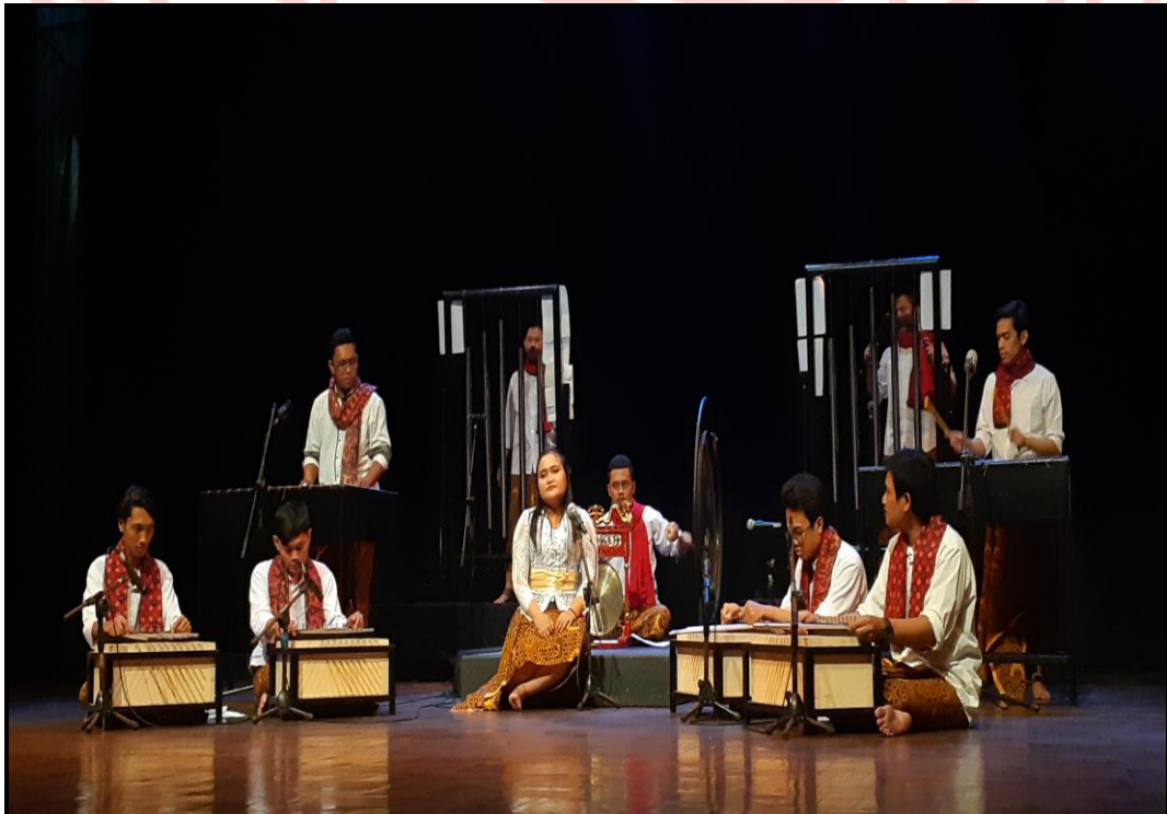
Gambar 27. Pentas karya musik "Asasta" (Foto Pratama, 24 Agustus 2020)