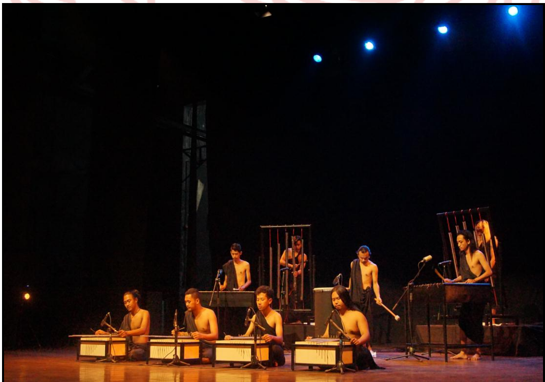
Gambar 21. Pentas karya musik "Ruhara" (Foto Pratama, 10 Agustus 2020)