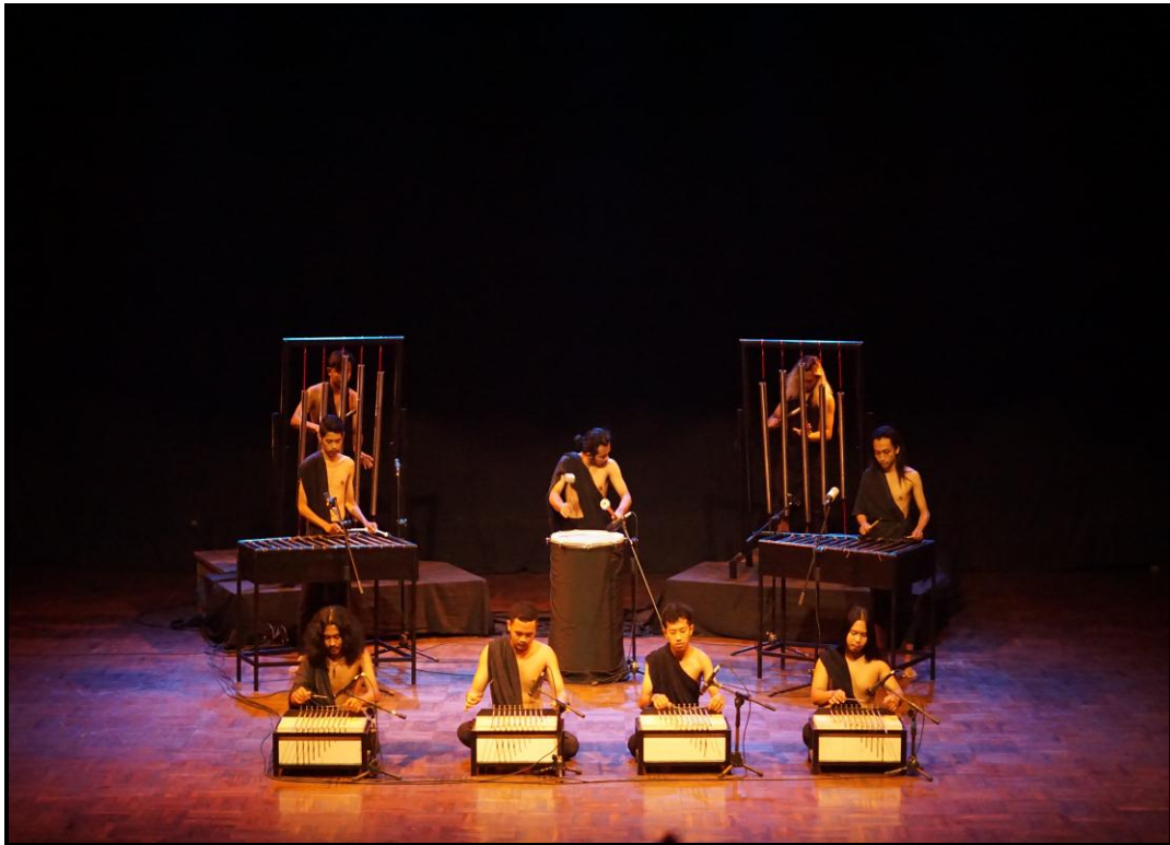
Gambar 24. Pentas karya musik "Ruhara" (Foto Pratama, 10 Agustus 2020)