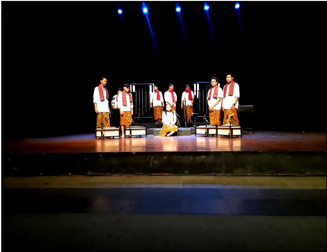
Gambar 26. Pentas karya musik "Asasta" (24 Agustus 2020)