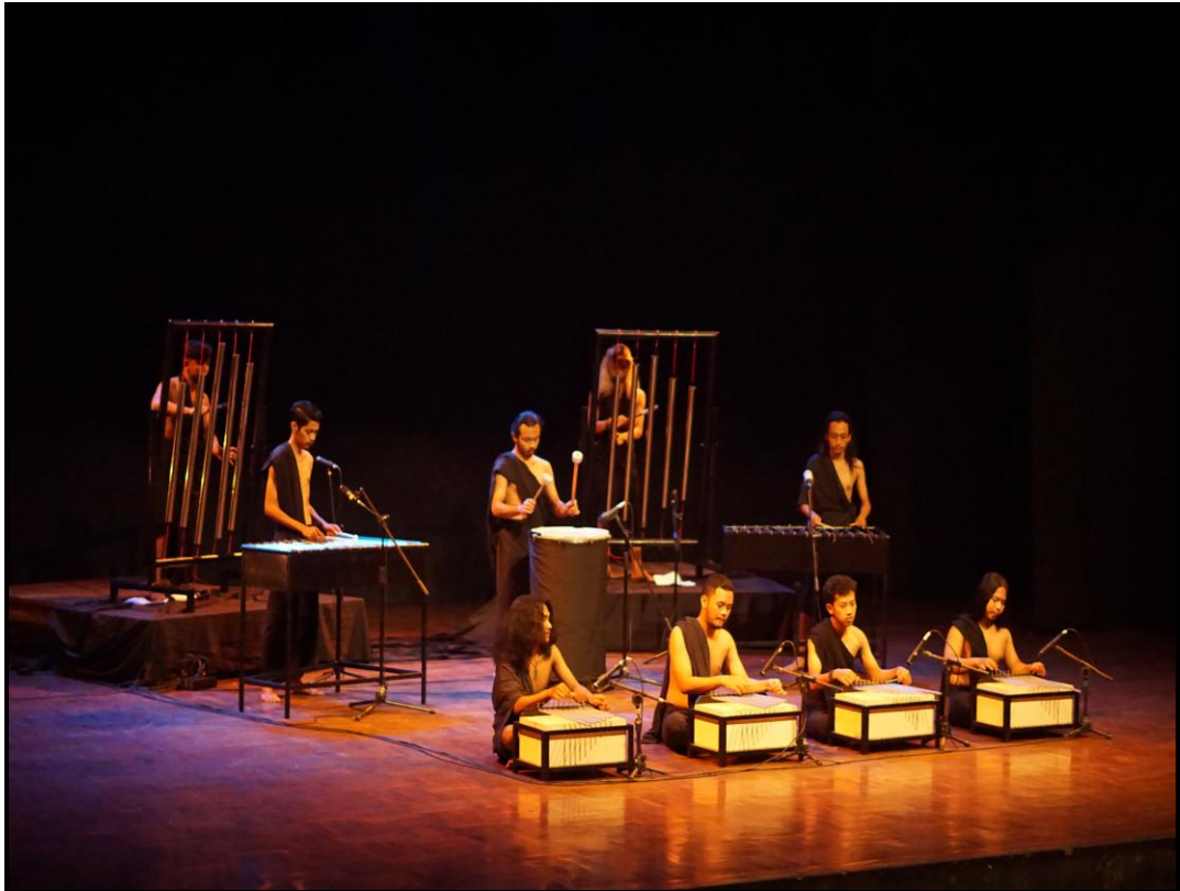
Gambar 20. Pentas karya musik "Ruhara"