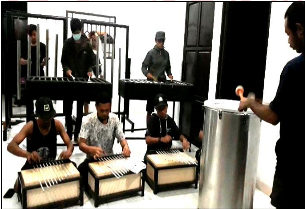
Gambar 17. Proses latihan bagian karya 1