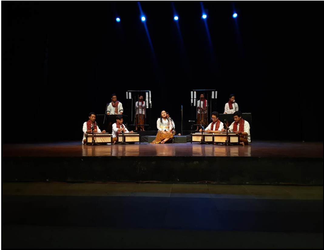
Gambar 28. Pentas karya musik "Asasta" (Foto Pratama, 24 Agustus 2020)