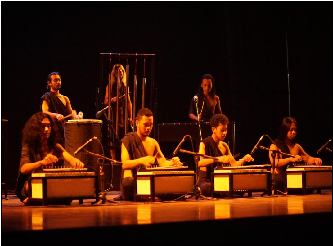
Gambar 22. Pentas karya musik "Ruhara" (Foto Pratama, 10 Agustus 2020)