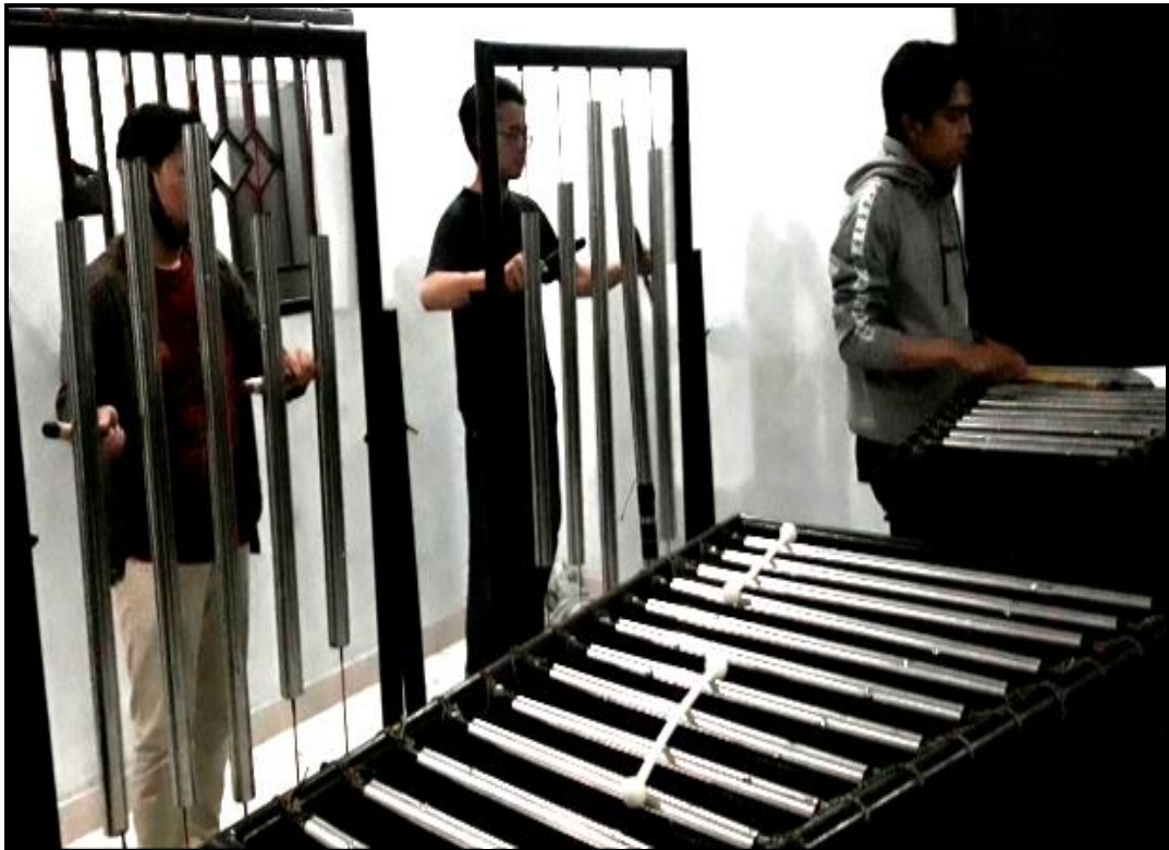
Gambar 18. Proses latihan bagian karya 2