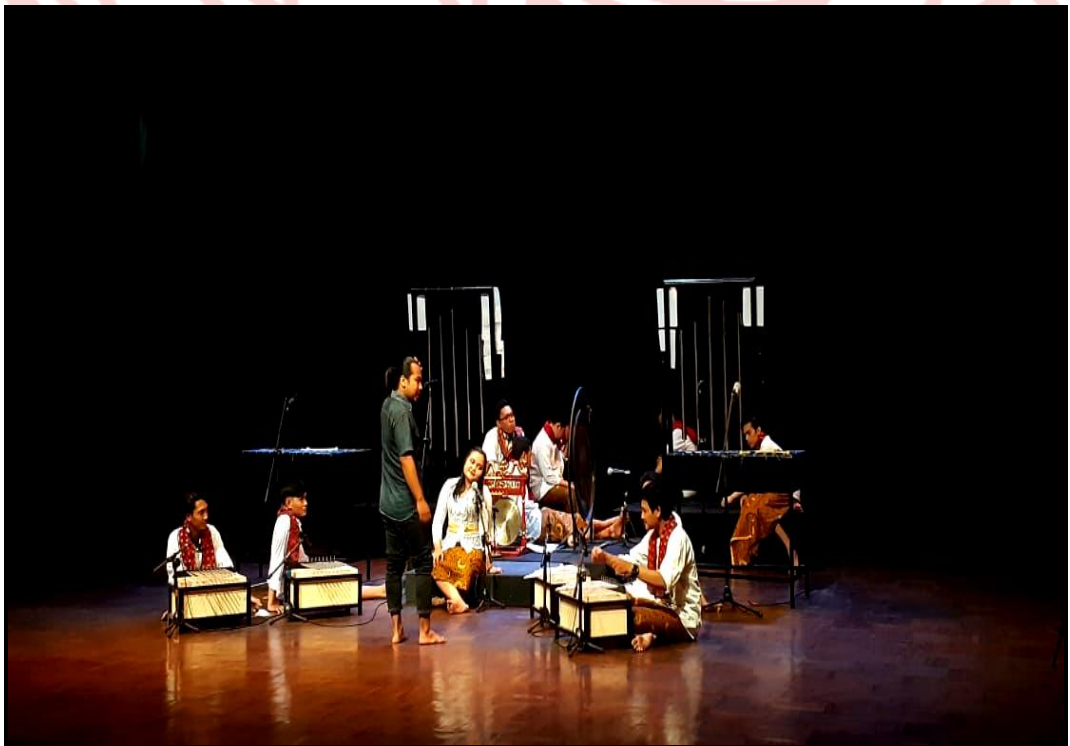
Gambar 25. Penyaji memberi pengarahannya sebelum pentas karya musik "Asasta"