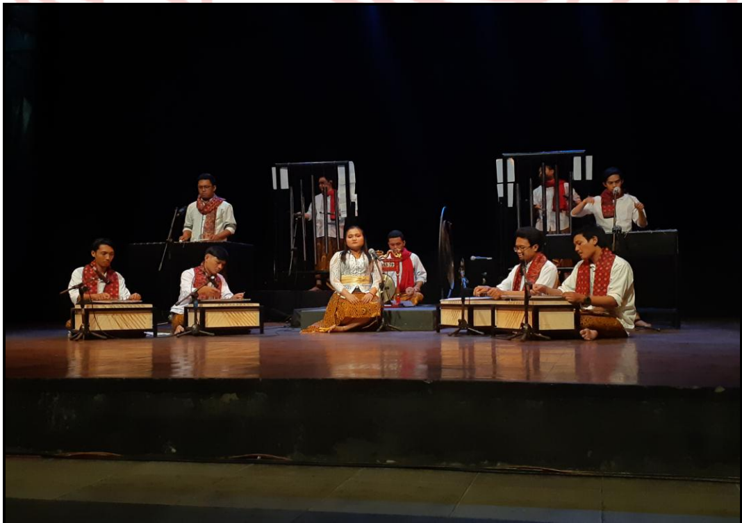
Gambar 29. Pentas karya musik "Asasta" (Foto Pratama, 24 Agustus 2020)