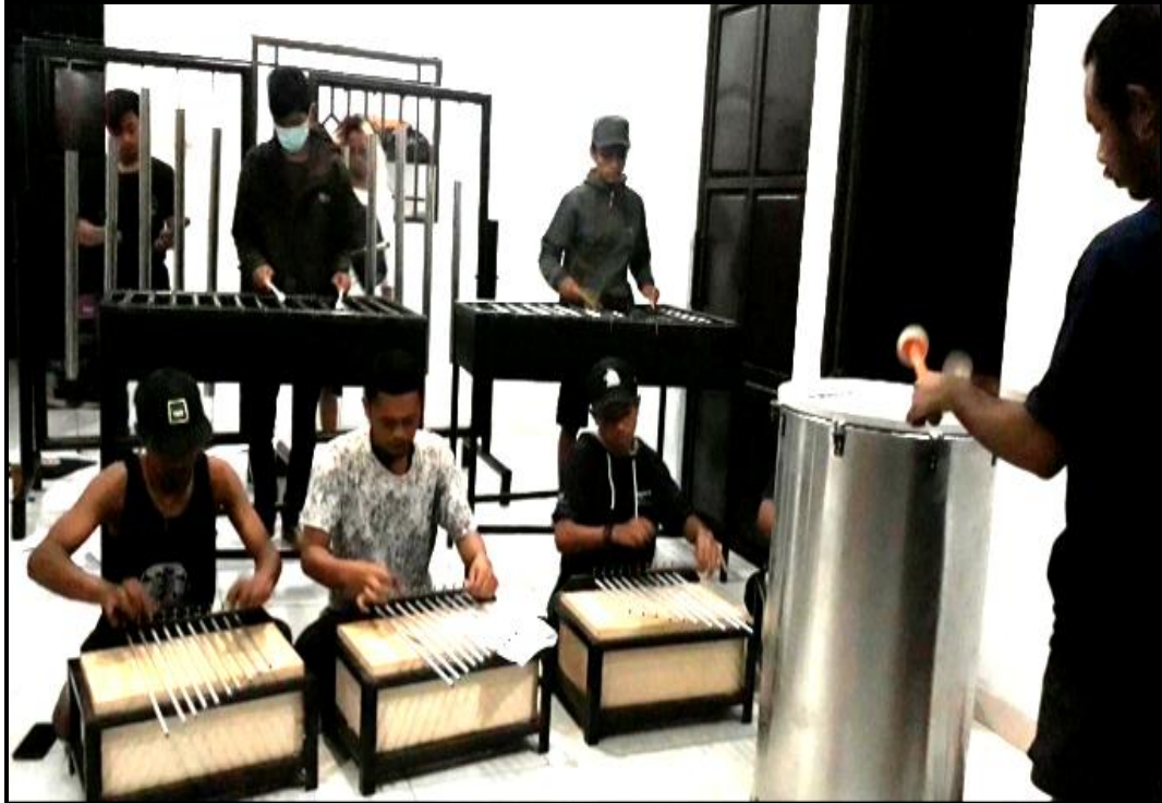
Gambar 16. Proses latihan bagian karya 1 (Foto Pratama, 2020)