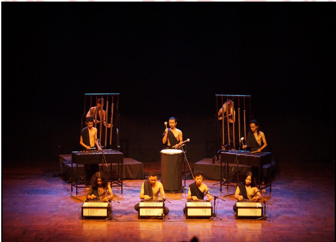
Gambar 23. Pentas karya musik "Ruhara" (Foto Pratama, 10 Agustus 2020)