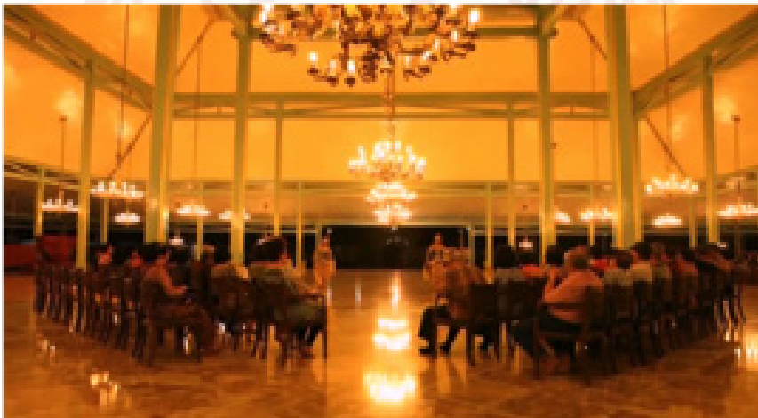
Gambar 1. Tata letak Kursi di ruang Pendhapa saat Wisata Dinner (Sunarmi: 25 Maret 2015)

lain. Pendhapa sebagai tempat upacara adat yang ditata dalam tata urut duduk sebagaimana tersebut dalam kekancangan KGPAA Mangkunegara IX yang mengatur tempat duduk dirinya bersama kakak dan kerabat sebagaimana dalam paugeran tata letak duduk pisowanan , tidak berlaku dalam kontek wisata dinner . Tata cara duduk pisowanan di Pendhapa diatur dalam babagan palenggahan ( Kekancangan Angka: 013/24.1/K/1988, Bab Adat Istiadat Mangkunegaran: 1-2, Arsip MN No 1325). Gambaran pola duduk tradisi Mangkunegaran diadaptasi pada pengaturan tata letak kursi untuk Royyal Dinner di Mangkunegaran lihat gambar di bawah).