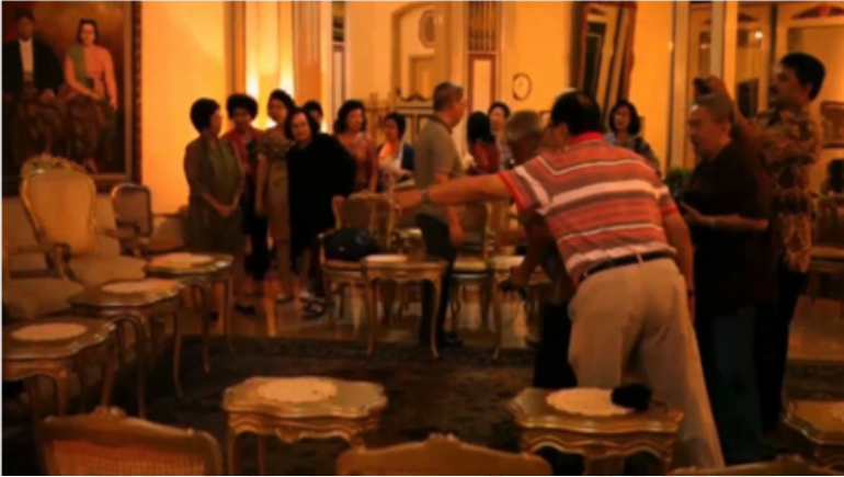
Gambar 6. Wisatawan Bergiliran Foto di depan Warana di Bangsas Pracimayasa (Sunarmi, 25 Maret 2015)

Kursi empat puluh sebagai tempat duduk kerabat dalam konsep pertemuan keluarga pada wisata dinner berubah sebagai studio foto/ foto booth . Interior Pracimayasa dengan seluruh elemen diatur berdasarkan hiraraki, cermin etika tata krama Jawa, oleh wisatawan sudah dimaknai sebagai tempat prestice untuk foto booth sekaligus sebagai tempat sosialita, Lihat gambar di bawah.