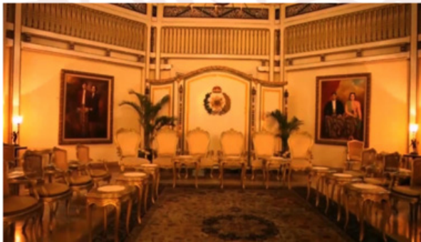
Gambar 5. Tata letak perabot Bangsals Pracimayasa saat Wisata Dinner (Sunarmi: 25 Maret 2015)

Keempat, bangsal Pracimayasa sebagai tempat pertemuan keluarga atau menemui tamu istana menjadi tempat makan Royyal Dinner . Bangsal adalah ruang pertemuan di lingkungan keraton atau lingkungan bangsawan. Pura Mangkunegaran, seperti halnya keraton-keraton di Jawa, berusaha membangun simbol personal untuk mengukuhkan diri, di antaranya menggunakan istilah bangsal untuk memberikan sebuah nama ruang pertemuan. Kuntawijaya menjelaskan, sebagai bentuk penghormatan, di Jawa terdapat hirarki bahasa (2004: 27). Hirarki bahasa digunakan untuk menunjukkan adanya tingkatan atau kedudukan. Istilah bangsal yang biasa digunakan di kalangan keraton tanda hirarki kedudukan. Bangsals tidak lazim untuk ruang rakyat biasa. Keberadaan Bangsals Pracimayasa yang ditandai dengan seluruh elemen interior tanda suasana interior ruang pertemuan Mangkunegaran dengan bakcdroup (sketsel). Warana merupakan perabot yang wajib dimiliki sebagai bagian dari elemen interior rumah tradisional Jawa (Sorgdrager, 1901: 7. Arsip MN No.1397: 10, Soeratman, 1989, 25). Warana di bangunan Pracimayasa tidak sekedar sebagai simbol privacy tetapi identitas sebuah ruangan tentang kepemilikan dan tanda kebesaran. Hal ini dapat dilihat adalah adanya logo pada sketsel/ warana dan foto sarimbit KGPAA Mangkunegara VIII di sisi kiri dan KGPAA Mangkunegara IX di sisi kanan, lihat gambar di bawah.