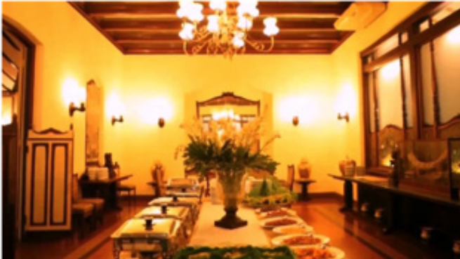
Gambar 3. Tata letak furniture Ruang Makan Pracimayasa Tempat Jamuan Wisata Dinner.