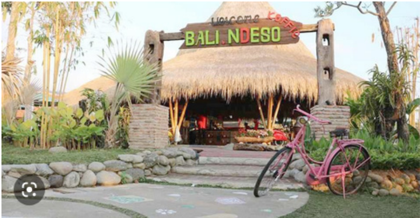
Gambar 11. Bar di Bali Ndesa Ngargoyoso Karanganyar

interior Bali, Nusa Tenggara, dll menjadi bagian yang dihadirkan pada interior Bali Ndesa . Jawa bagi Endang Sedep adalah jiwa dan raganya, oleh karena itu rumah dibangun dengan cita rasa Jawa, walaupun menghadirkan bahan-bahan modern, karakteristik Jawa tetap dapat dirasakan (wawancara Endang Sedep, 2022).