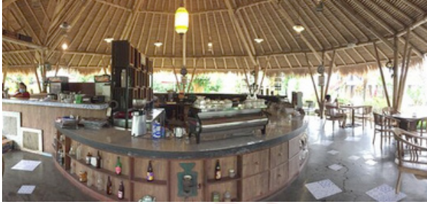
Gambar 12. Interior Bar Bali Ndesa Ngargoyoso Karanganyar

Cita rasa Jawa dihadirkan di Bali Ndesa dari eksterior dan interior. Hampir secara keseluruhan bangunan di Bali Ndesa menggunakan bentuk atap rumah tradisi Jawa, namun bangunan utama berupa pendhapa besar sebagai pusat seluruh bangunan lainnya, lihat gambar di bawah.