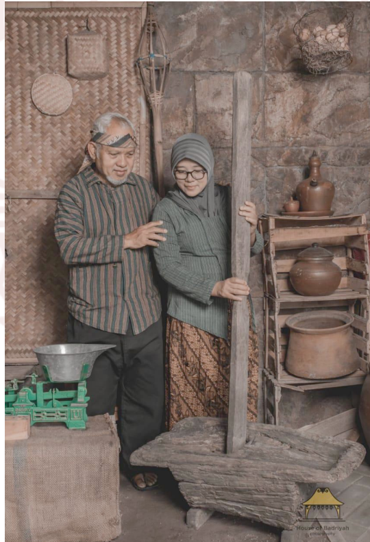
Gambar 9. Sanggit Mutrani Interior Tradisi Nutu di Jawa Pada Resto Ndalem Kopi

menyediakan fasilitas interior ala tempo dulu diorientasikan sebagai penghidupan masa lampau sesaat sebagai romantisme masa lampau. Romantisme masa lampau yang dimaksud di sini adalah suasana yang mendorong orang berperilaku pada suasana masa lampau karena saat ini sudah mulai jarang ditemukan. Mengenang suasana atau orang memasuki suasana tertentu dengan cara berperilaku, karena memang ada kemungkinan orang zaman sekarang sudah tidak mengalami suasana memasak di pawon , nutu pari , dan berlatih gamelan. Gambar di bawah adalah suasana yang dipolakan untuk romantisme masa lampau. Sesaat orang berbusana dan berperilaku sebagaimana tradisi.