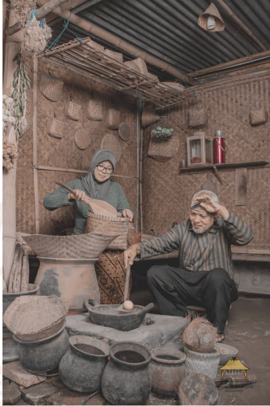
Gambar 8. Sanggit Mutrani Pawon Jawa pada Resto Ndalem Kopi

Orang dapat menikmati suasana sekaligus mengenang dengan cara berperilaku sementara ke dalam suasana rumah tradisi di pawon . Bagi orang yang sudah pernah mengalami suasana tersebut maka suasana dalam fotoboth tersebut untuk mengenang, sementara bagi orang yang belum pernah merasakan, maka suasana tersebut adalah sebuah simulasi gambaran suasana seakan dalam suasana tertentu. Pawon adalah salah satu ruangan pada rumah tradisi Jawa untuk memasak ala Jawa. Pawon sebenarnya merupakan tempat memasak yang terbuat dari tanah liat dengan kayu bakar sebagai sumber api untuk memasak, namun pada interior fotoboth tersebut, api menggunakan listrik. Ndalem Kopi