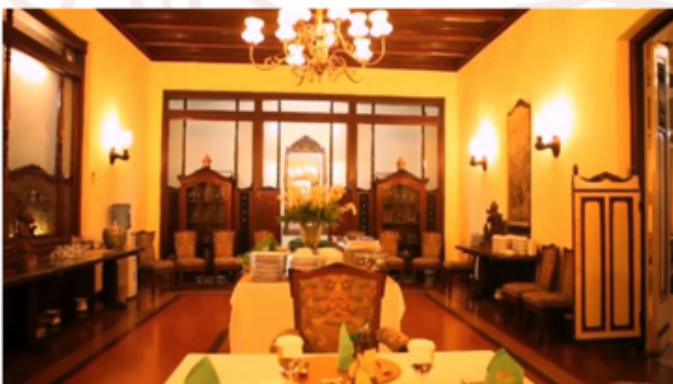
Gambar 4. Tata Letak Perabot Ruang Makan Pracimayasa (Sunarmi: 25 Maret 2015)

Berbagai asesoris ruang dan interior Pracimayasa dipertahankan untuk membangun suasana tentang ruang makan keluarga Istana Mangkunegaran. Supriyanto menjelaskan, “untuk wisata dinner atau lunch , interior bangunan Pracimayasa sengaja dipertahankan untuk menampilkan suasana aslinya” (wawancara, 24 Maret 2015). Habitus tradisi tata letak elemen interior rumah tradisi kapangeranan menenguhkan bentuk tata letak Pracimayasa untuk Royyal Dinner .