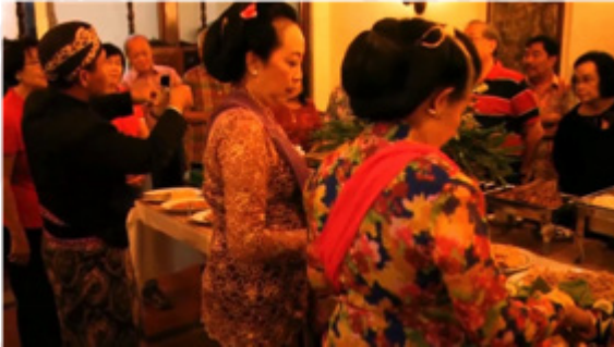
Gambar 2. Ruang makan Pracimayasa sebagai tempat Jamuan

Ketiga , interior ruang makan Pracimayasa sebagai tempat jamuan wisata Royyal Dinner , lihat gambar di bawah. Wisatawan memperoleh kesempatan menikmati dinner di ruang Pracimayasa.