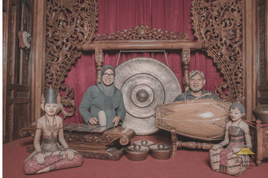
Gambar 10. Sanggan Mutrani Interior Rumah Tradisi Jawa di Resto Ndalem Kopi Dok. Sunarmi, April 2021)

Reproduksi elemen interior rumah tradisi di Ndalem Kopi dengan di Mangkunegaran memiliki kesamaan. Masing-masing elemen interior rumah tradisi untuk membangun suasana mutrani sebagaimana aslinya. Interior dirancang untuk membangun citra. Citra orang nutu , memasak di Pawon Ndesa , berlatih gamelan sama sekali tidak berkaitan dengan realitas. Citra orang nutu , memasak di Pawon Ndesa , berlatih gamelan merupakan simulakra murni, karena sebenarnya yang terjadi hanyalah simulasi citra orang nutu , memasak di Pawon Ndesa , berlatih gamelan, yang ada hanya simulasi menjadikan membangun suasana sebagai wadah tempat citra orang nutu , memasak di Pawon Ndesa , berlatih gamelan. Konsep berlebihan dapat dilihat pada upaya aktor reproduksi elemen interior rumah tradisi dengan menyediakan segala atribut pada studio photo akhirnya dikonsumsi oleh pengunjung. Pengunjung menangkap dan menikmati dalam hiperrealitas nutu , ngliwet di pawon ndesa , berlatih gamelan sebagai pengalaman estetis ( esthetic experience ).