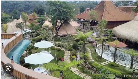
Gambar 13. ebagian Bangunan Bali Ndesa Tampak dari Sisi Atas (Repro Sunarmi 2023)

Cita rasa Jawa dihadirkan di Bali Ndesa dari eksterior dan interior. Hampir secara keseluruhan bangunan di Bali Ndesa menggunakan bentuk atap rumah tradisi Jawa, namun bangunan utama berupa pendhapa besar sebagai pusat seluruh bangunan lainnya, lihat gambar di bawah.