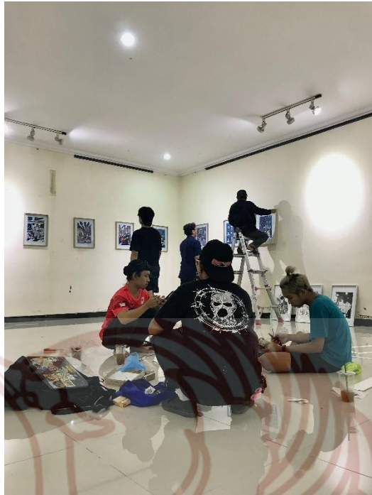
Gambar 5. 4 Proses Diplay Pameran Tugas Akhir