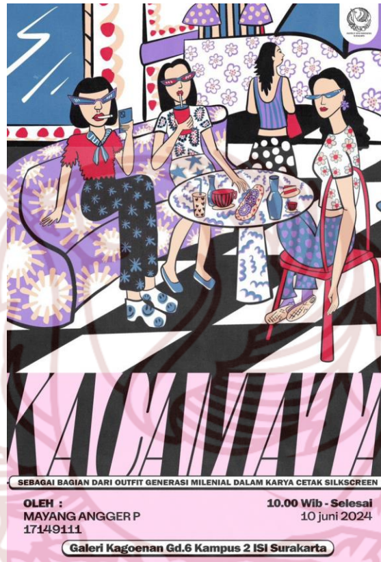
Gambar 5. 1 Poster Pameran Tugas Akhir