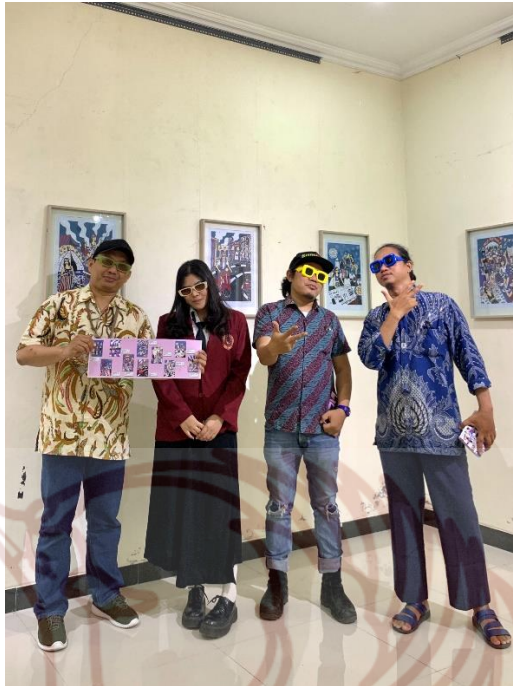
Gambar 5. 6 Dokumentasi Pameran Tugas Akhir