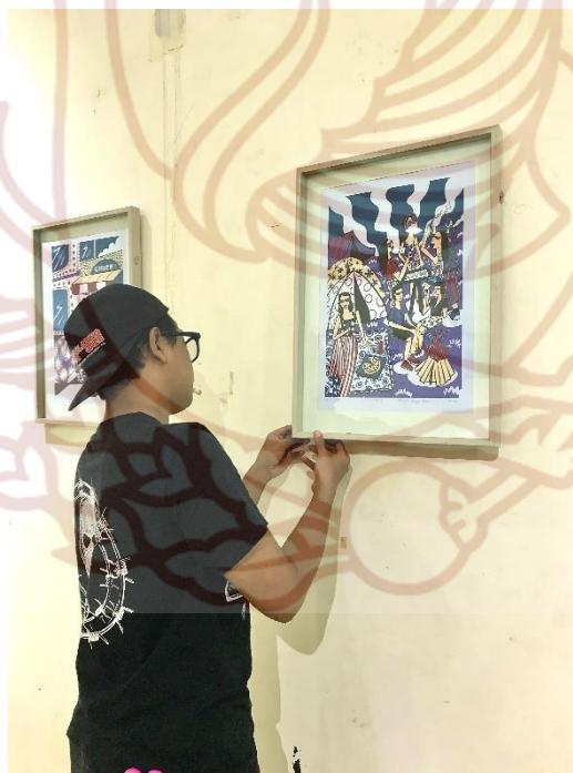
Gambar 5. 3 Proses Diplay Pameran Tugas Akhir