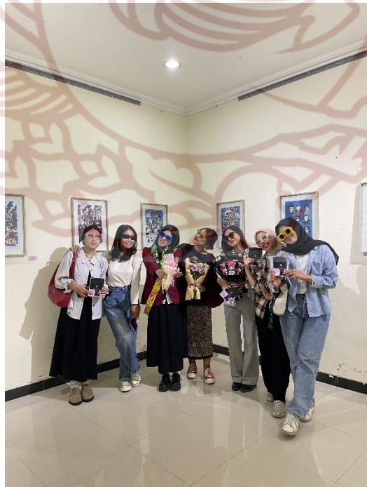
Gambar 5. 5 Dokumentasi Pameran Tugas Akhir