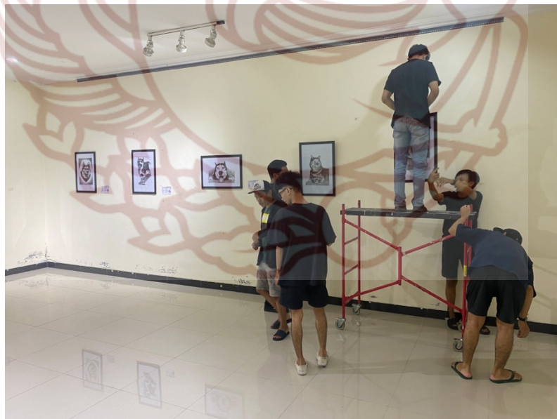
Foto proses display karya Tugas Akhir