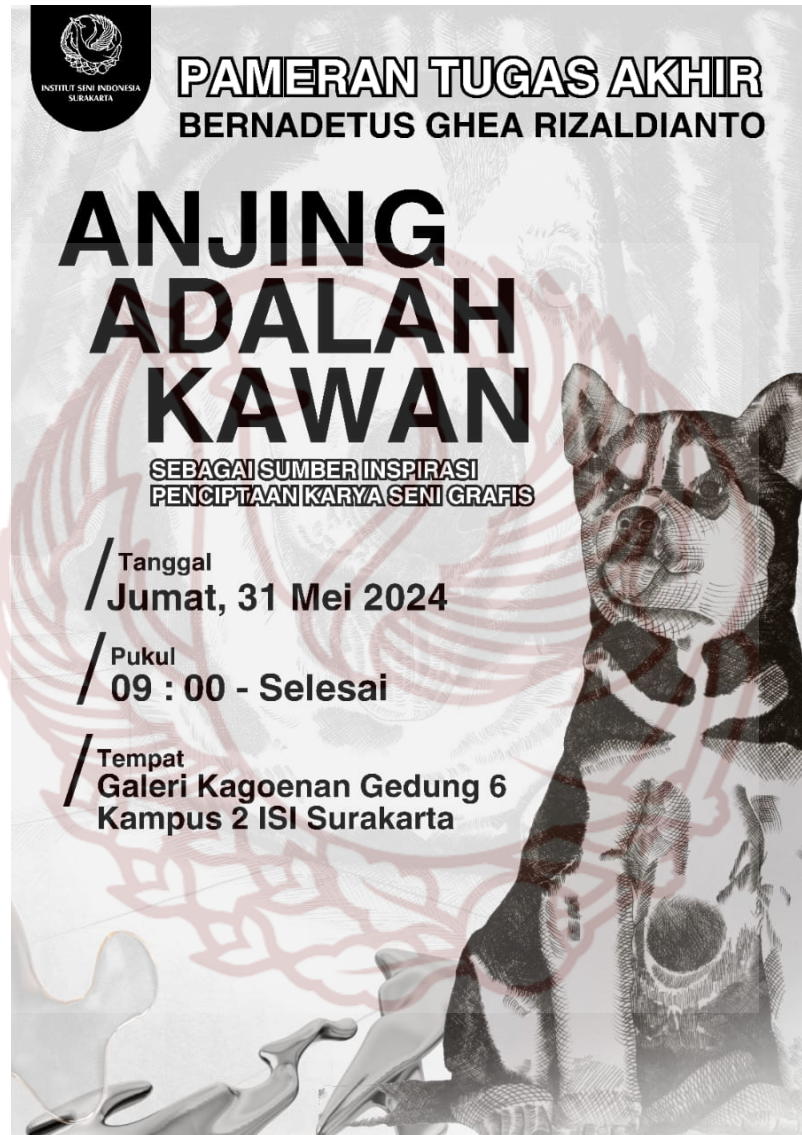
Desain pamflet publikasi Pameran Tugas Akhir