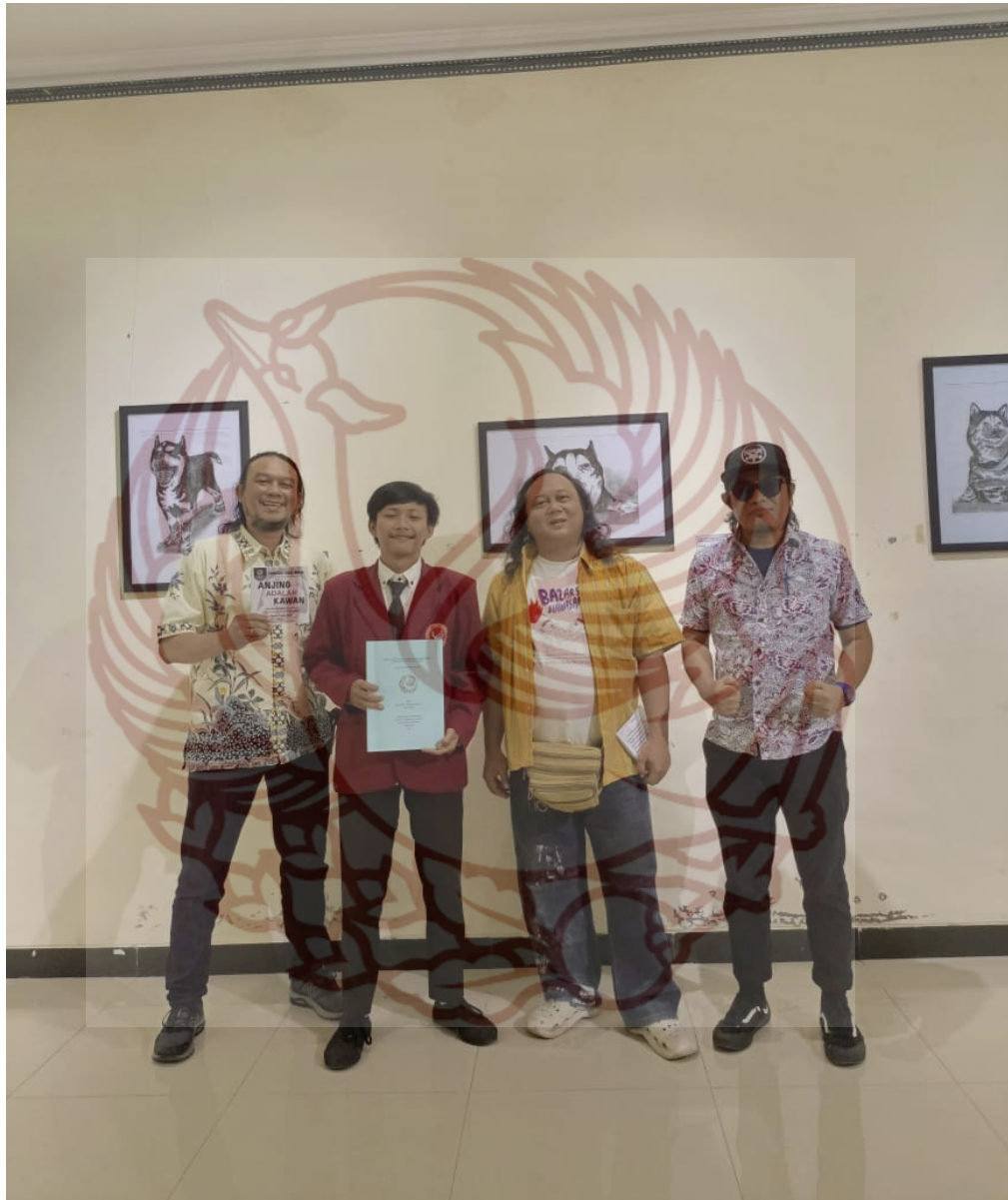
Foto bersama Pembimbing dan Penguji Tugas Akhir