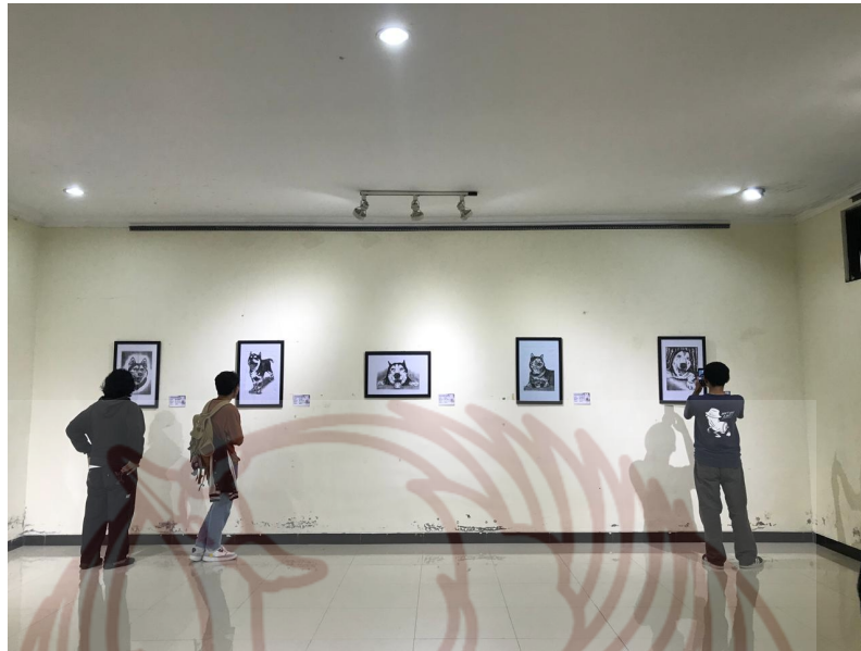
Foto acara Pameran Tugas Akhir (sumber: Bernadetus Ghea, 31 Mei 2024)