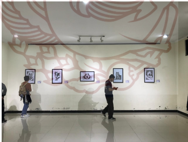
Foto acara Pameran Tugas Akhir