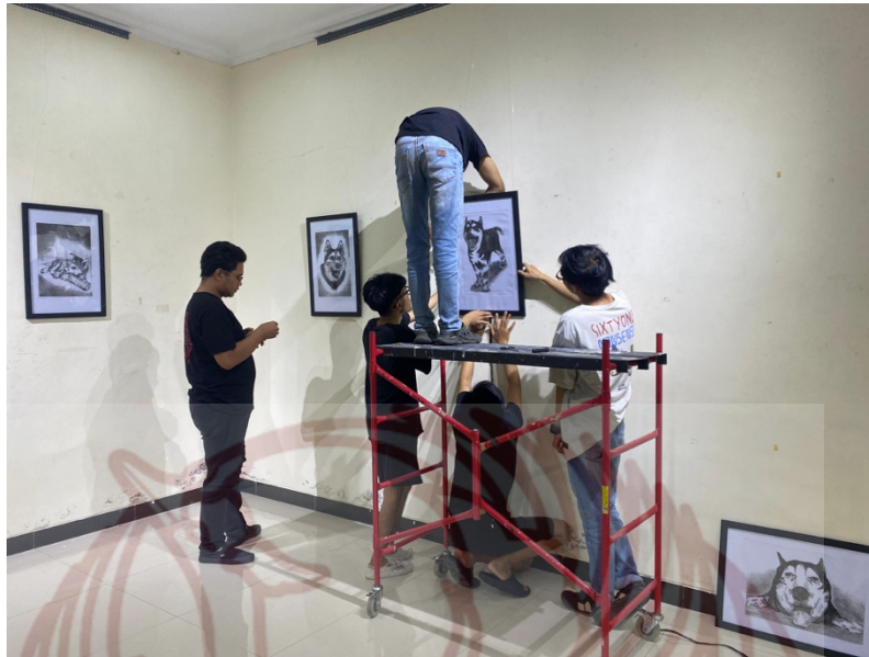
Foto proses display karya Tugas Akhir (sumber: Bernadetus Ghea, 30 Mei 2024)