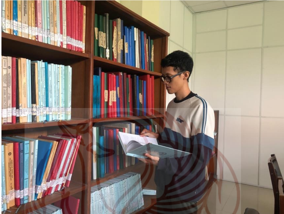
Gambar 14. Kegiatan Pengumpulan Data di Perpustakaan