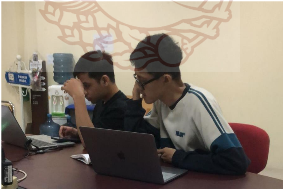
Gambar 15. Proses Pelaksanaan Penelitian