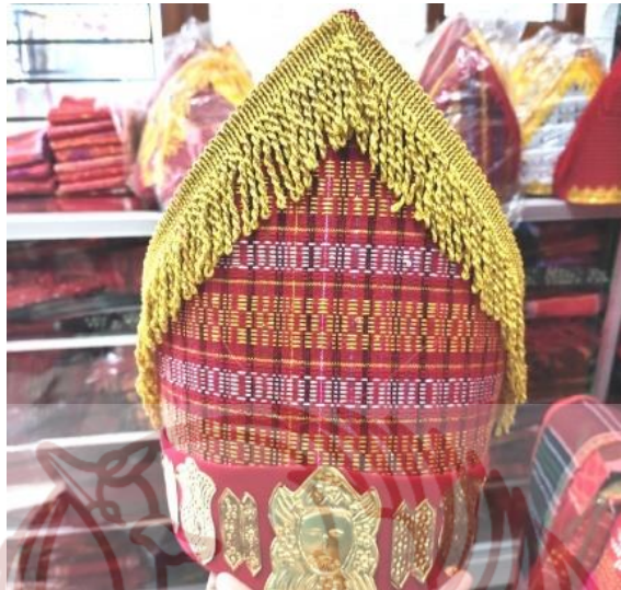
Gambar 12. Sortali Batak Pria