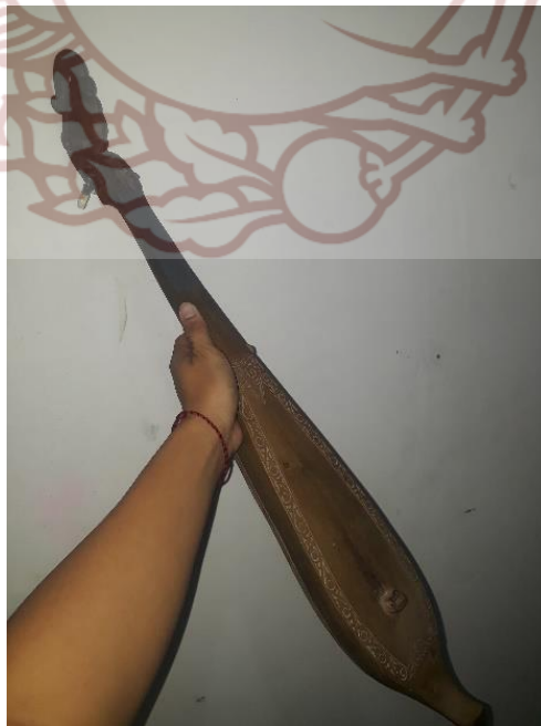
Gambar 18. Hasapi milik Lusper Sinurat