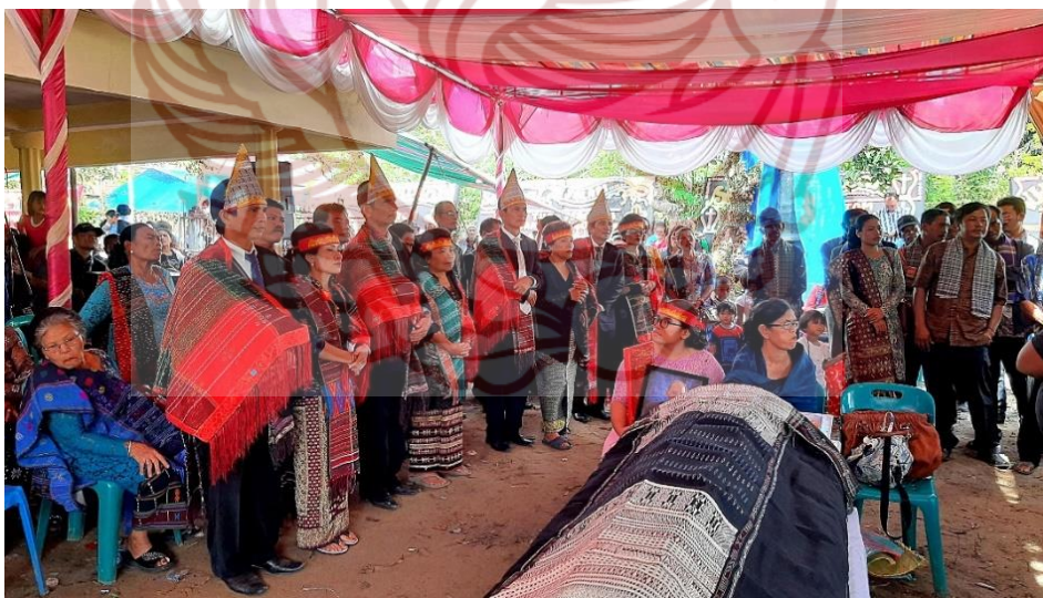
Gambar 5. Pesta Meninggal Adat Batak Toba.