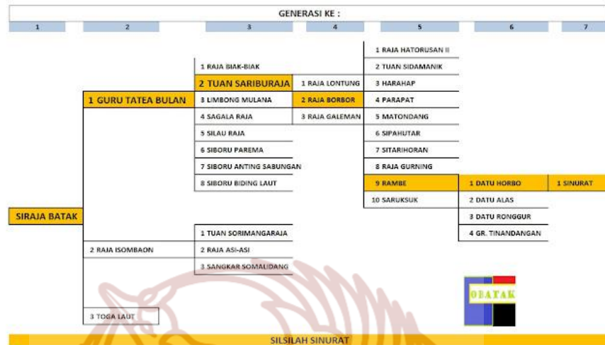
Gambar 1. Silsilah Marga Sinurat mulai dari Si Raja Batak