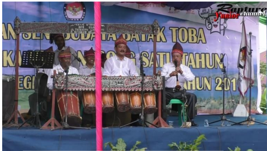
Gambar 3. Pementasan Gondang Sabangunan di Balige 21 April 2018