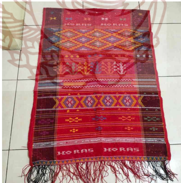
Gambar 2. Ulos Sadum.