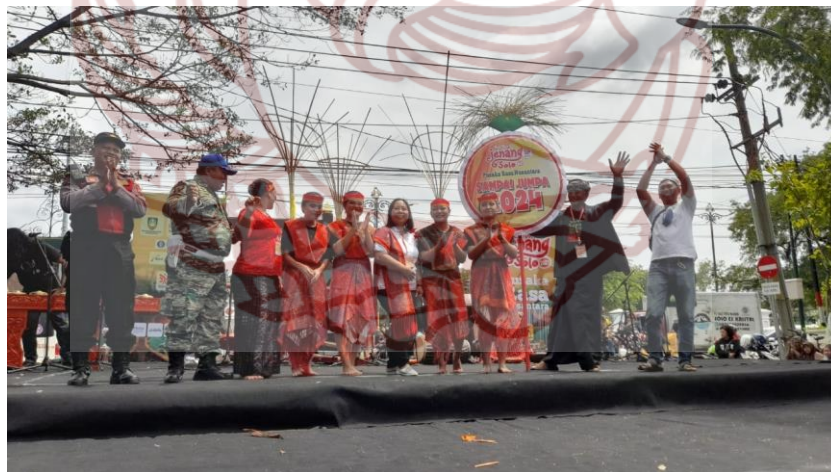
Gambar 9. Masyarakat Batak yang mengikuti HUT Solo ke 278 pada 17 Februari 2023