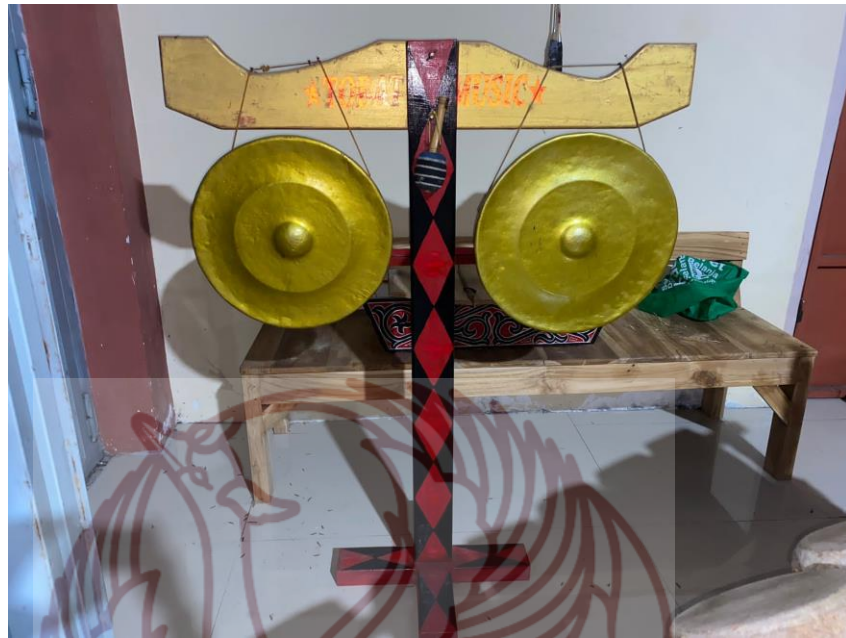
Gambar 17. Ogung Oloan dan Ihutan milik Lusper Sinurat