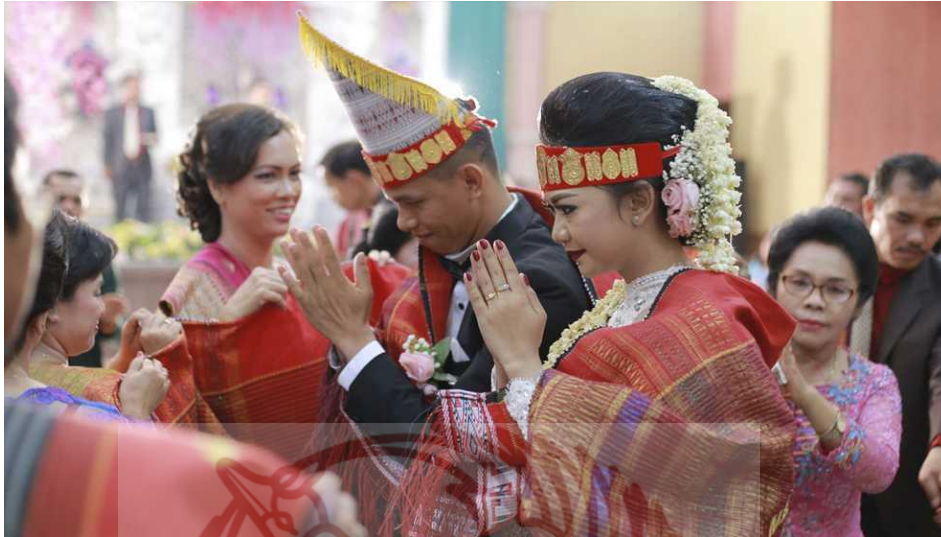
Gambar 6. Upacara Pernikahan Adat Batak Toba