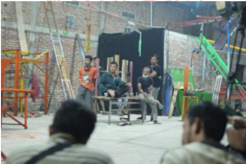
Gambar 29. Para Pekerja Las Menduduki Kursi di Ruang 4