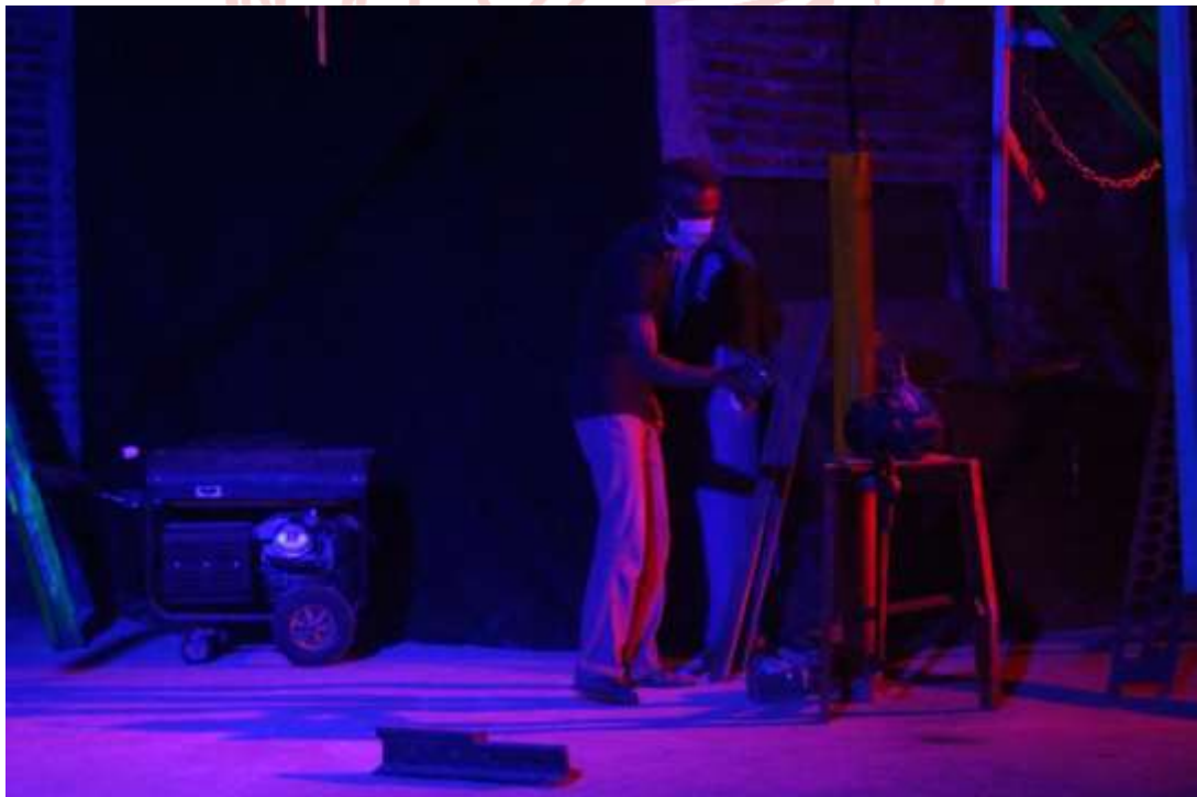
Gambar 23. Proses Pengecatan dengan PiloX di Ruang 4 (Dok. Rizza Jajuk, 2020)