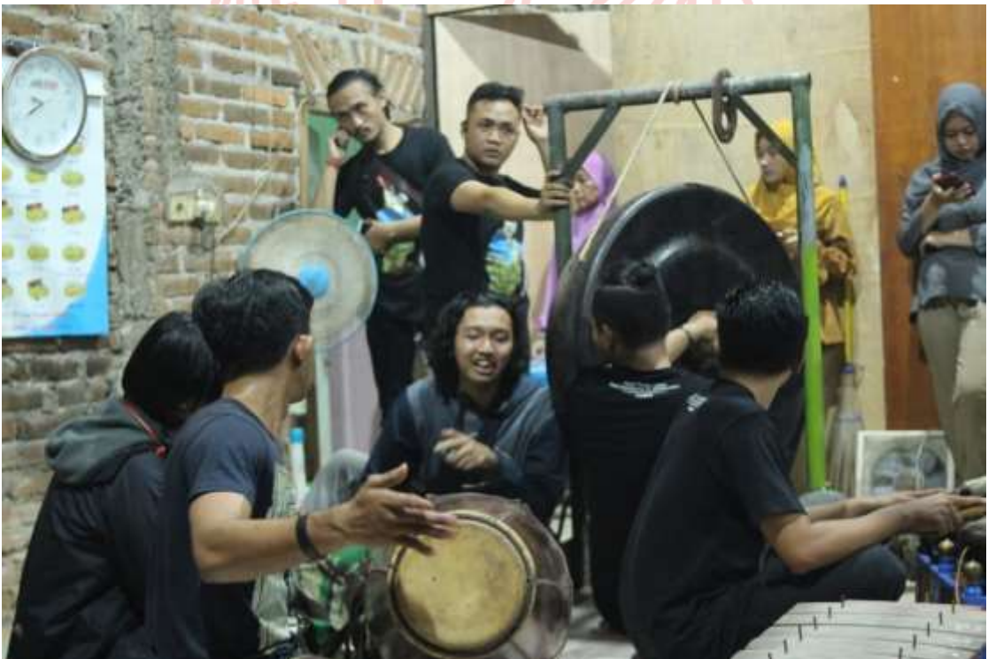
Gambar 27. Hiburan Pertunjukan Musik Gamelan Di Ruang Tunggu (Dok. Rizza Jajuk, 2020)