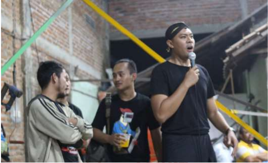
Gambar 28. Sambutan dari MC Di Ruang Tunggu