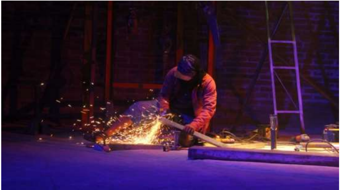
Gambar 22. Proses Pengelasan dalam Pembuatan Kursi di Ruang 4