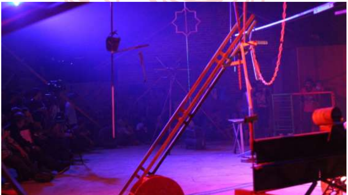
Gambar 21. Para Penonton yang menyaksikan pertunjukan di Ruang 4