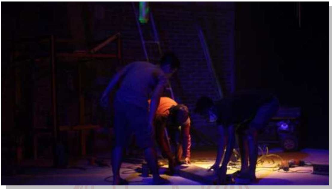
Gambar 20. Proses Pembuatan Kursi di Ruang 4