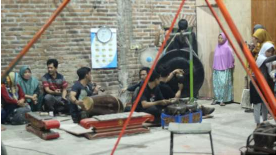
Gambar 26. Hiburan Pertunjukan Musik Gamelan Di Ruang Tunggu