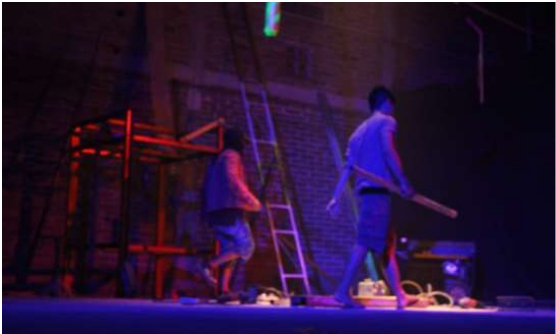
Gambar 24. Proses Pengelasan dalam Pembuatan Kursi di Ruang 4