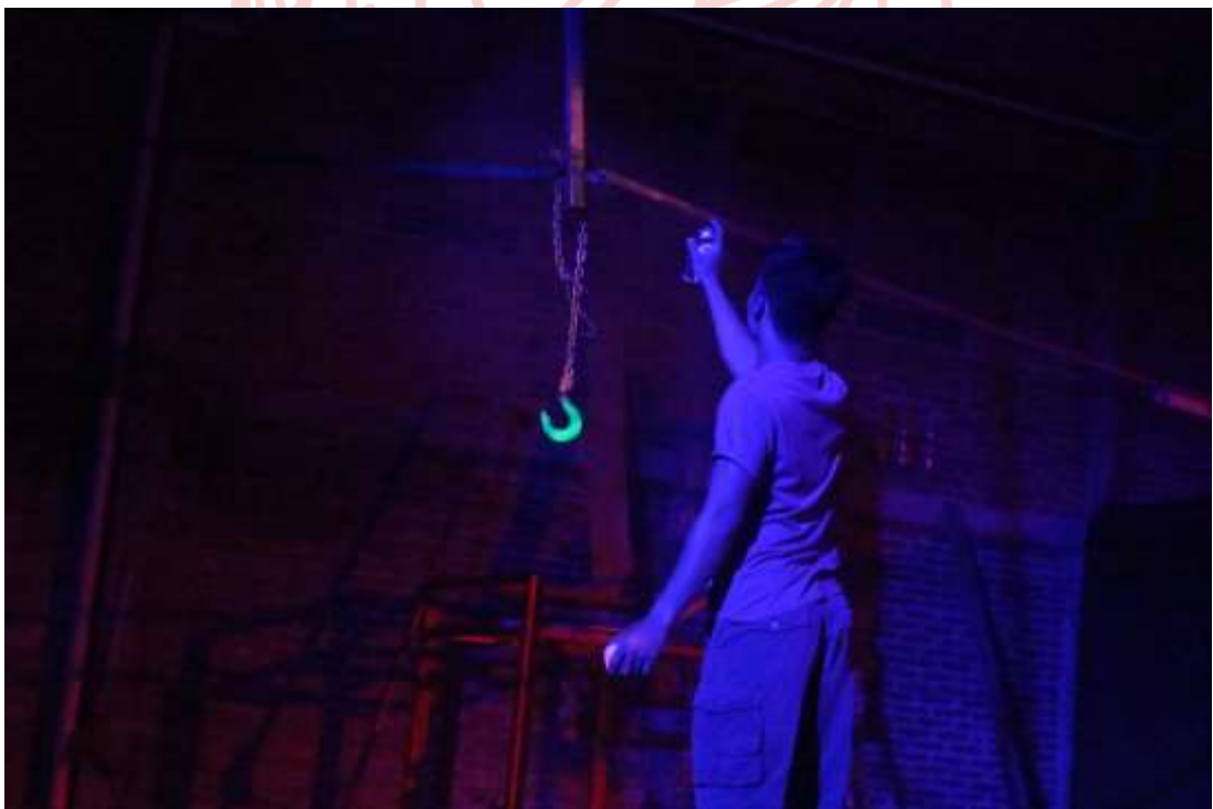
Gambar 25. Proses Pengecatan dengan PiloX di Ruang 4