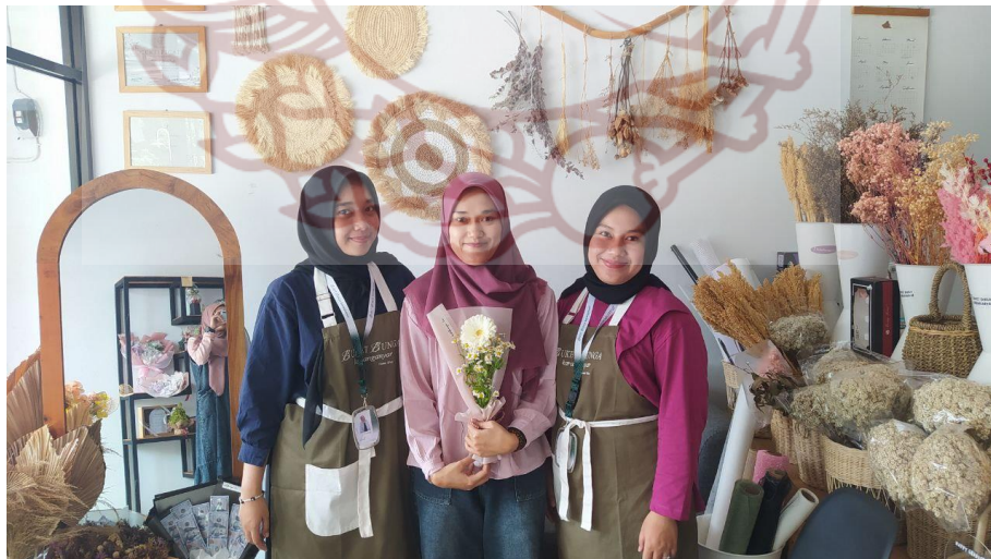
Gambar 107. Foto Bersama Narasumber Perangkai Bunga