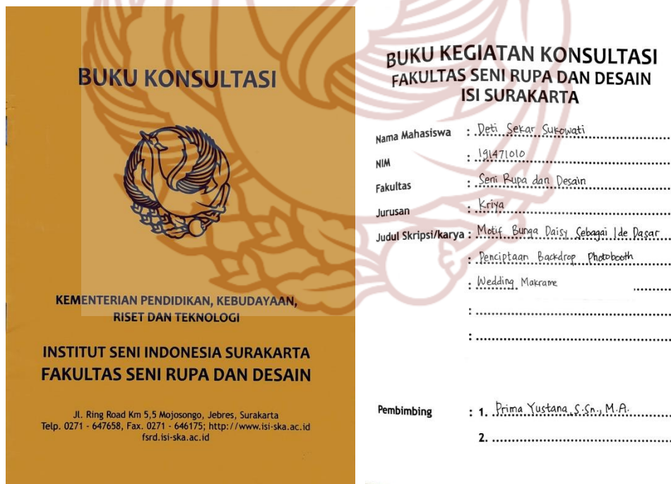
Gambar 109. Buku Konsultasi