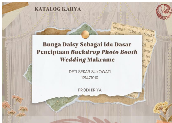
Gambar 108. Katalog Karya