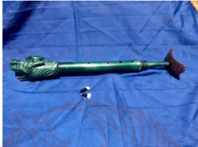
FOTO INSTRUMEN MUSIK KESENIAN JARANAN JOKO MBALELO