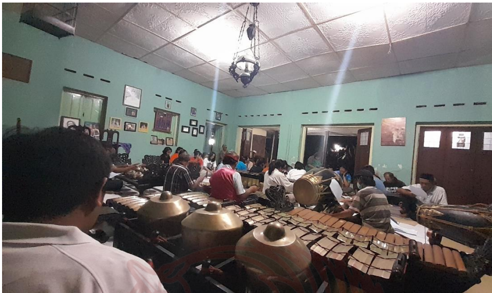
Gambar 8 Proses latihan paduan suara Lingkungan PAN untuk tugas menggunakan gamelan (dokumentasi pribadi, Mei 2023)