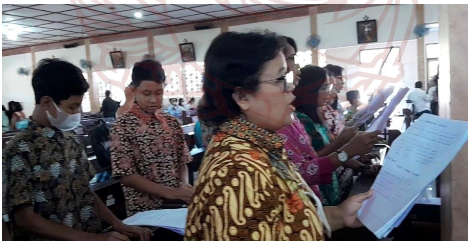
Gambar 11 Lingkungan PAN tugas paduan suara di Gereja Macanan menggunakan iringan pada tanggal 28 Mei 2023