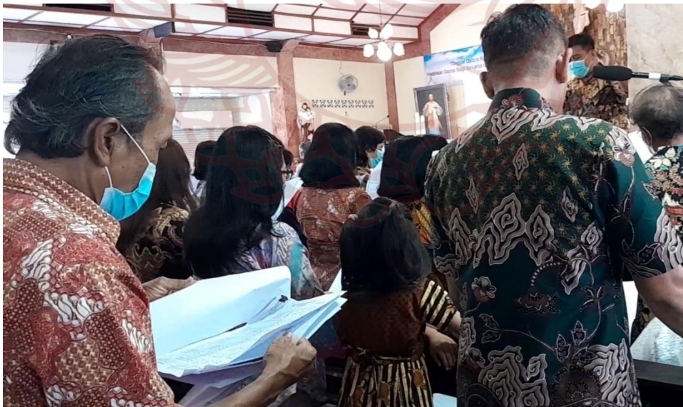
Gambar 9 Lingkungan PAN tugas paduan suara di Gereja Macanan menggunakan iringan pada tanggal 28 Mei 2023