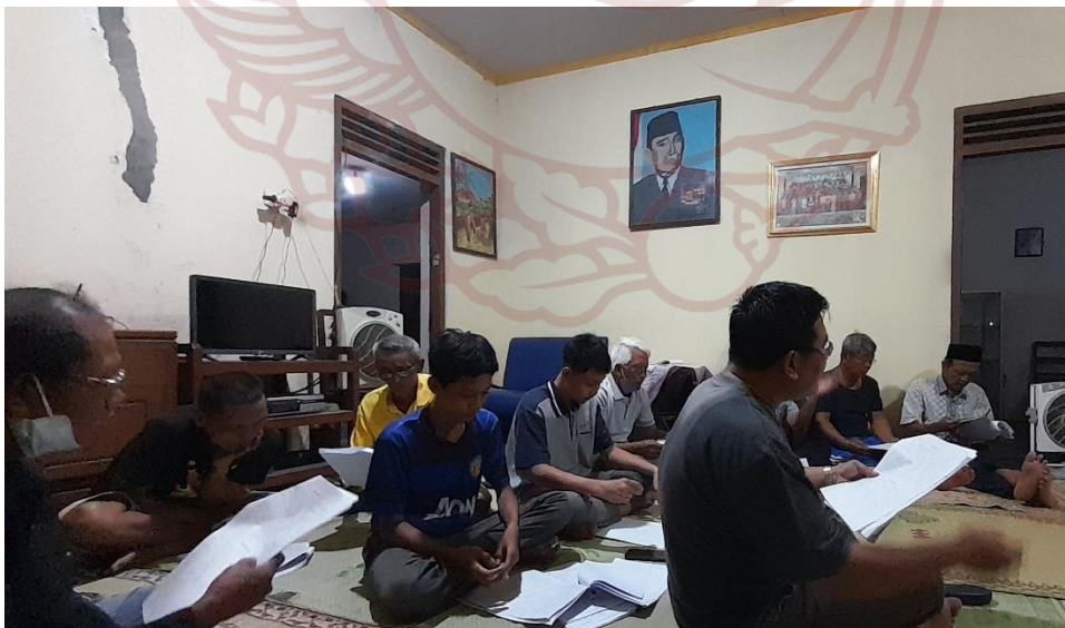
Gambar 7 Proses latihan paduan suara Lingkungan PAN untuk tugas menggunakan gamelan (dokumentasi pribadi, Mei 2023)