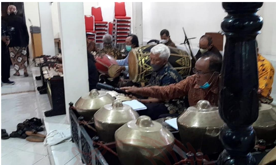
Gambar 10 Lingkungan PAN tugas paduan suara di Gereja Macanan menggunakan iringan pada tanggal 28 Mei 2023 (dokumentasi pribadi)