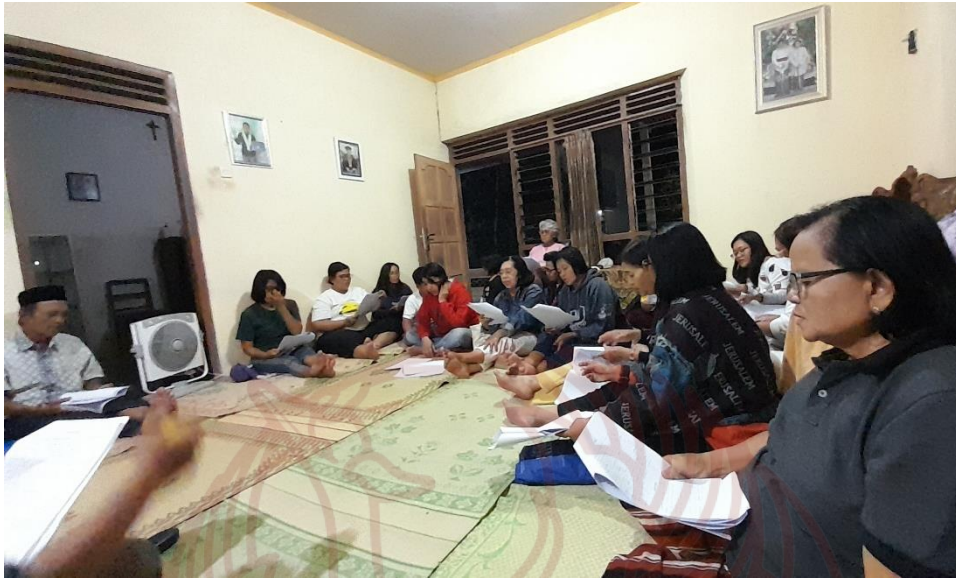
Gambar 6 Proses latihan paduan suara Lingkungan PAN untuk tugas menggunakan gamelan