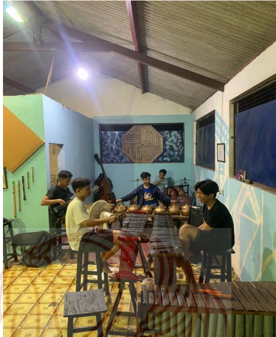
Gambar 1. Proses latihan di studio kemlaka (Taman Budaya Jawa Tengah)