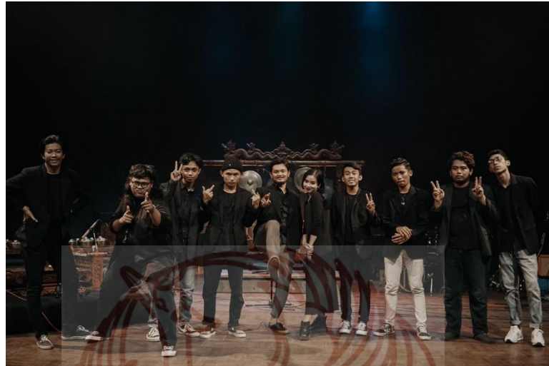
Gambar 1.6 foto bersama pendukung setelah pengambilan video