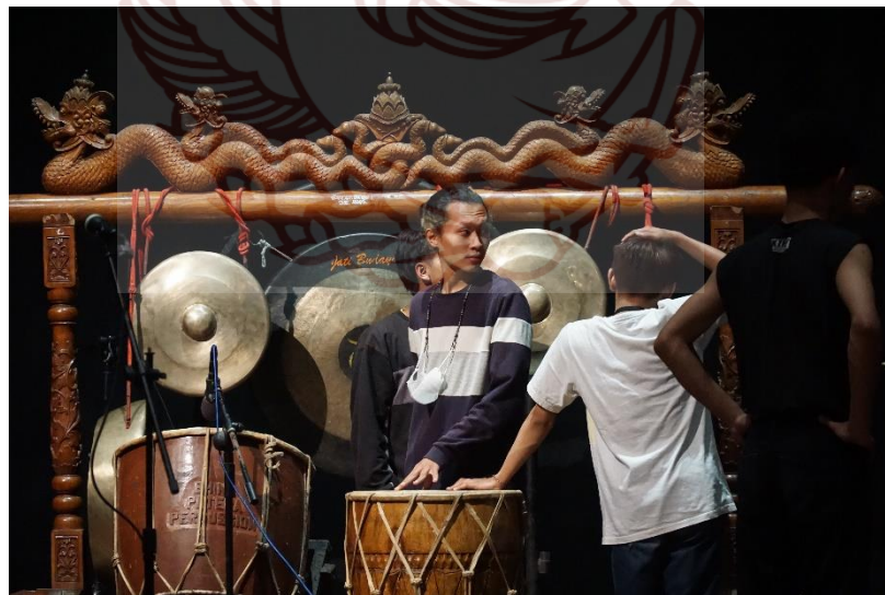
Gambar 4. setting panggung sebelum pengambilan video