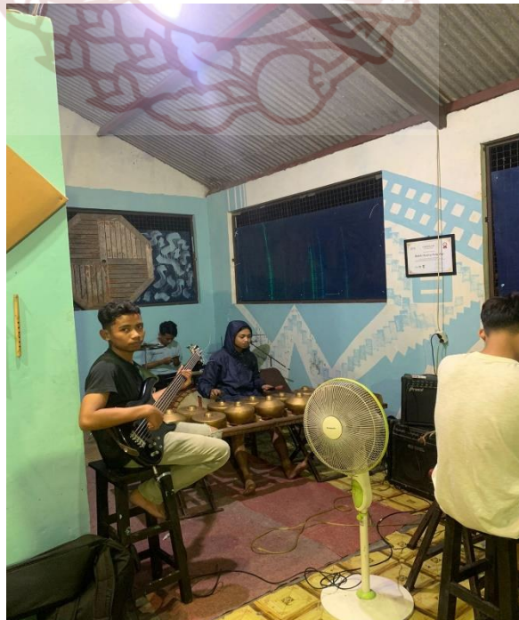
Gambar 2. Proses latihan di studio Kemlaka (Taman Budaya Jawa Tengah)