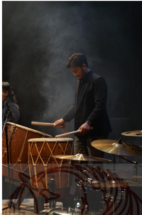
Gambar 5. Proses pengambilan video