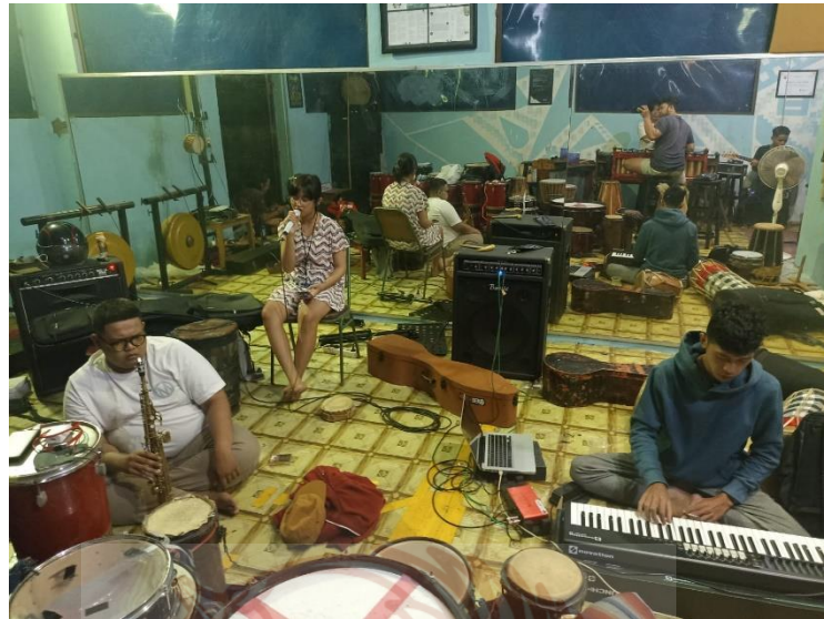
Gambar 3. Proses latihan di studio Kemlaka (Taman Budaya Jawa Tengah)