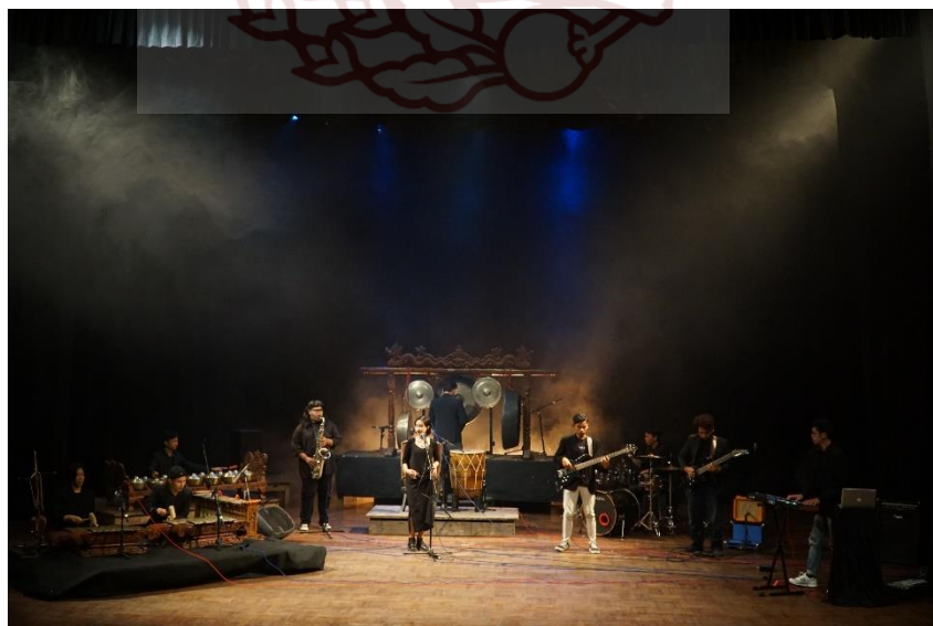
Gambar 6. Proses Pengambilan video