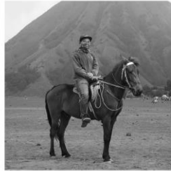
VISUALISASI SIMPUL SARUNG ADAT SUKU TENGER DALAM FOTOGRAFI POTRET