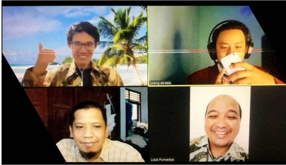
Lampiran 5. Ujian Pendadaran