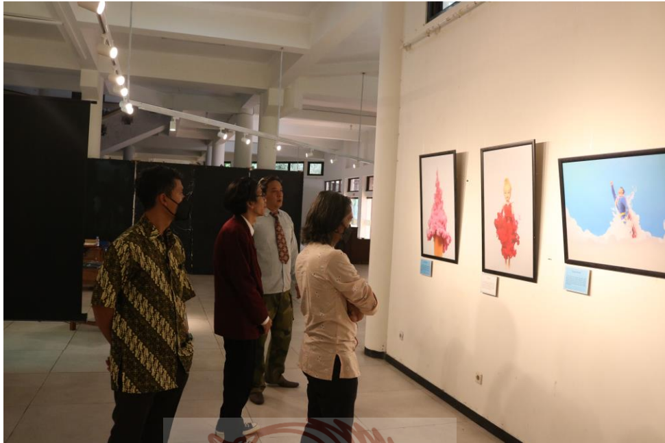
Gambar 49. Pembimbing dan Pemnguji mengunjungi pameran Foto Akis 2022