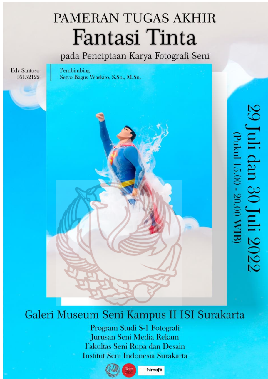
Gambar 46. Desain poster