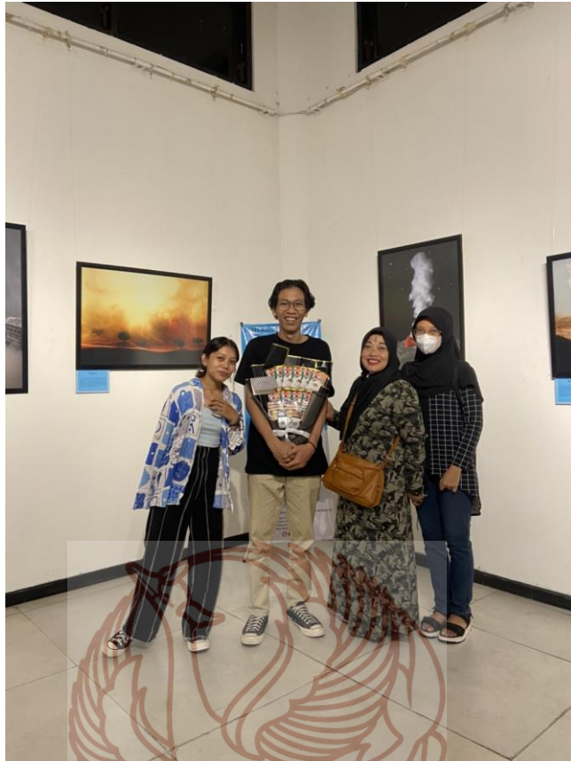
Gambar 53. Foto bersama Keluarga Foto Akis 2022