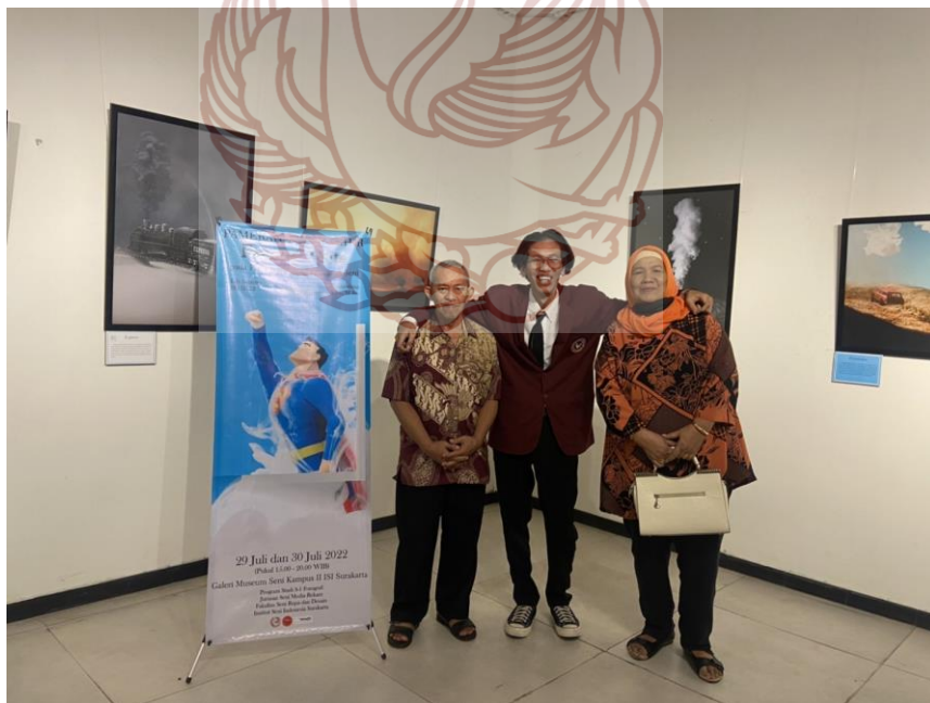
Gambar 52. Foto bersama Keluarga Foto Widha 2022