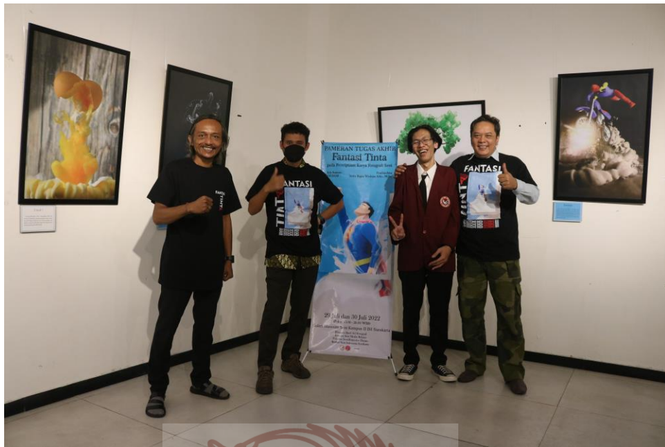
Gambar 51. Foto bersama Pembimbing dan Penguji