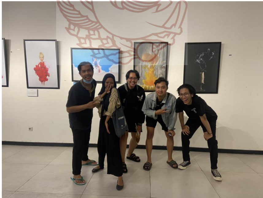
Gambar 56. Foto bersama teman-teman Prodi Fotografi Foto Anisa 2022