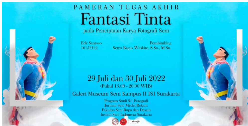
Gambar 47. Desain Banner