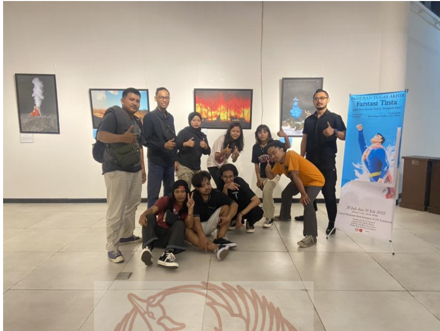
Gambar 55. Foto bersama teman-teman Prodi Fotografi Foto Bagus 2022