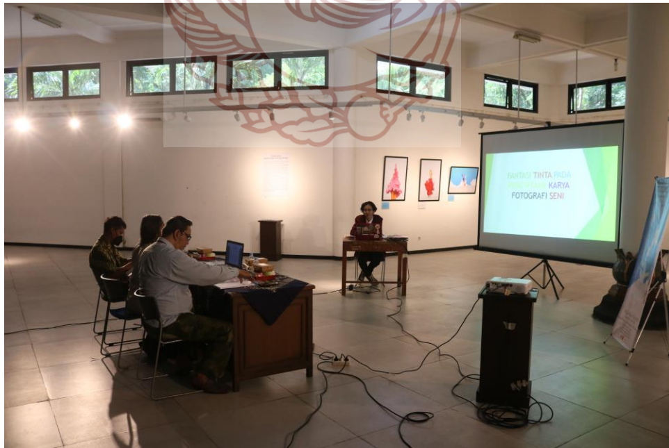
Gambar 50. Suasana Ujian Pendadaran Foto Akis 2022