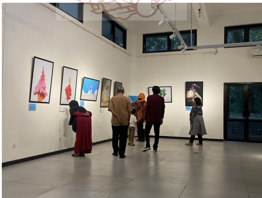
Gambar 54. Suasana ruang pameran Foto Anisa 2022