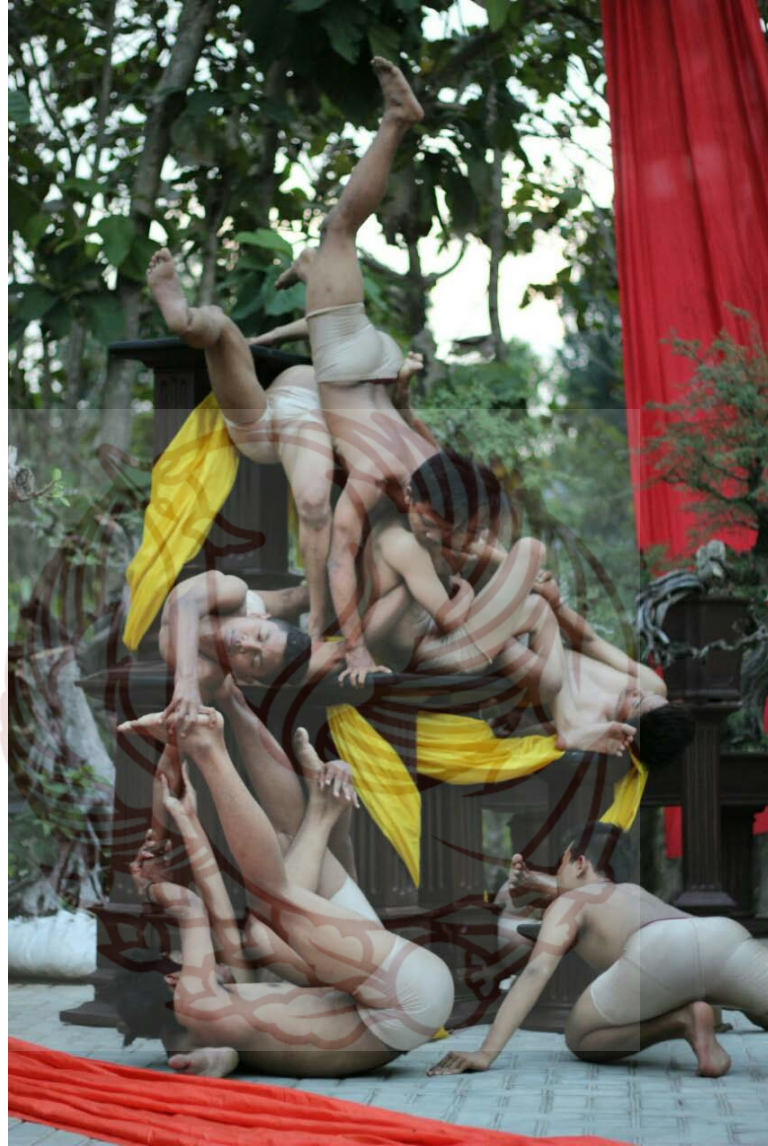
Gambar 4. Eksplorasi intensitas plintiran tubuh