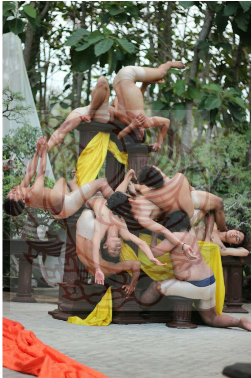
Gambar 2. Eksplorasi intensitas plintiran tubuh