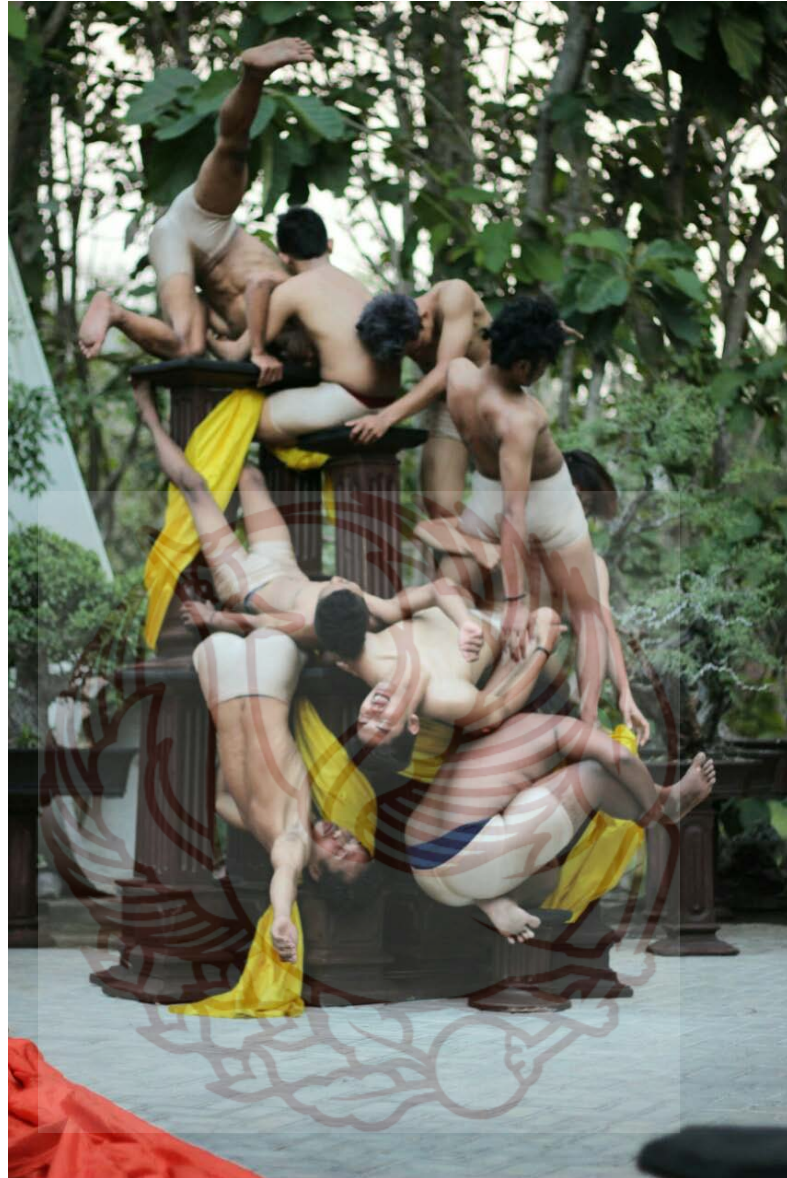
Gambar 3. Eksplorasi intensitas plintiran tubuh