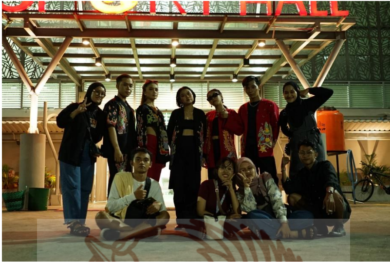
Gambar 65. Fotoshoot Tugas Akhir 22 Juli 2022