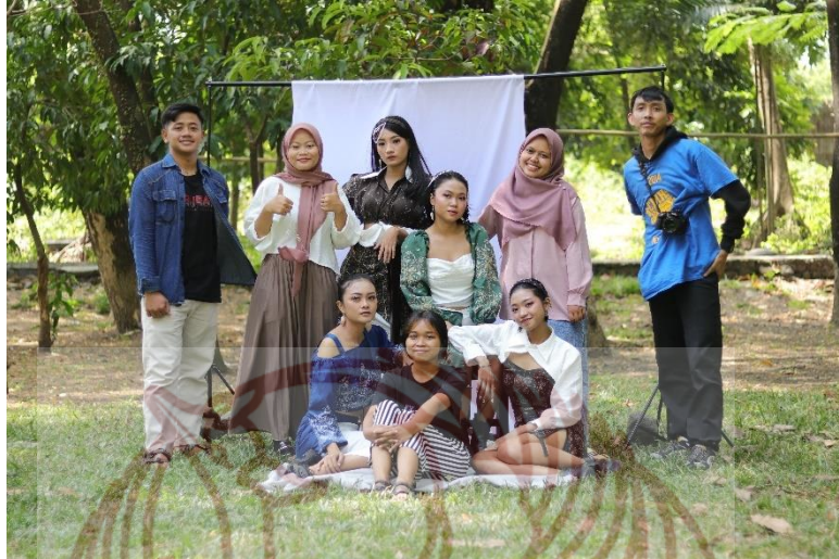
Gambar 88. Fotoshoot Tugas Akhir