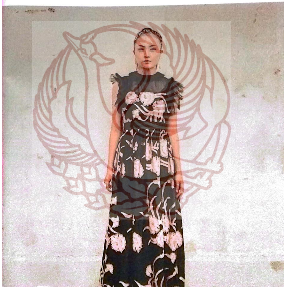
Keterangan Gambar : Sampul Catalog Karya