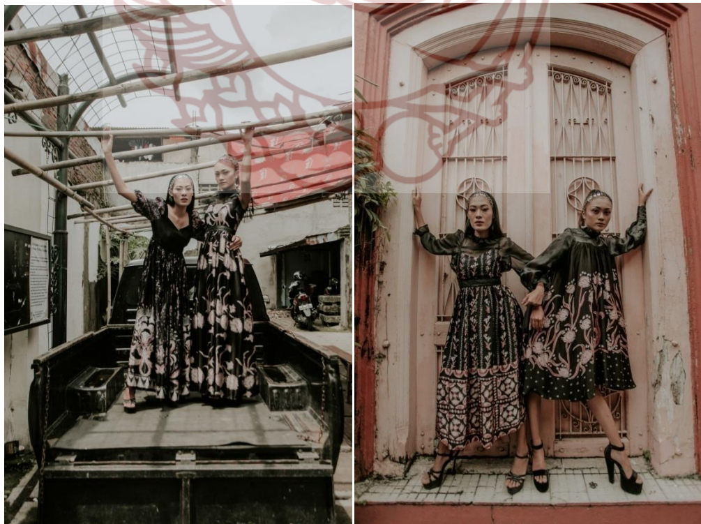
Keterangan Gambar : Hasil foto pemotretan karya di kampung batik Kauman.