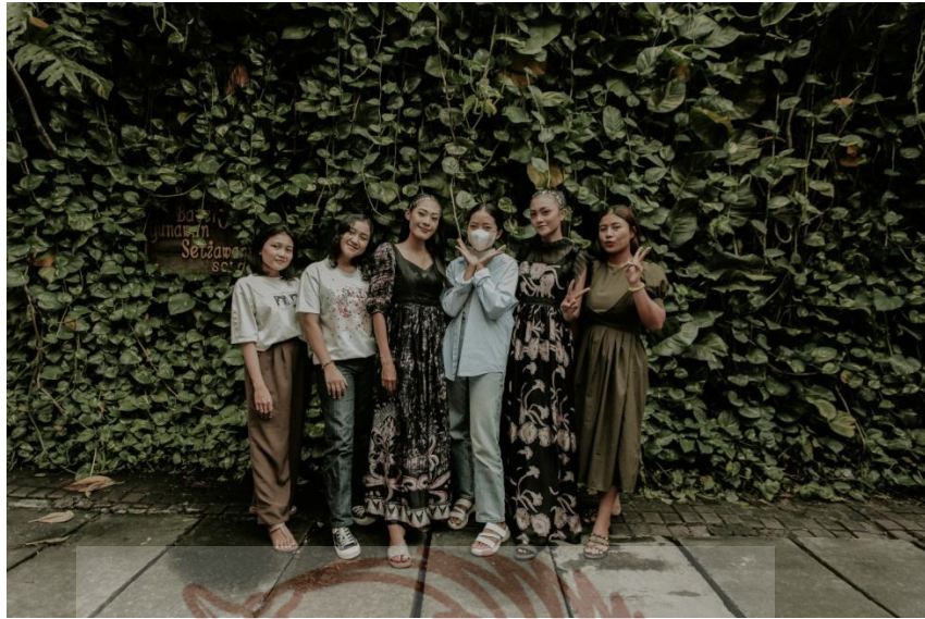
Keterangan Gambar : Foto bersama team pemotretan karya busana di kampung batik Kauman Surakarta.