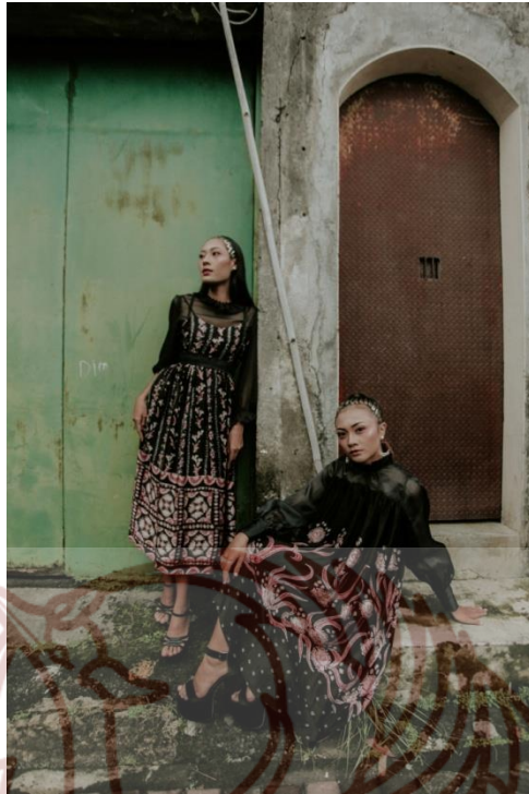
Keterangan Gambar : Hasil foto pemotretan karya di kampung batik Kauman.