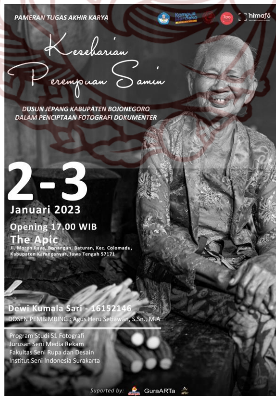
Lampiran 3. Poster tugas akhir karya