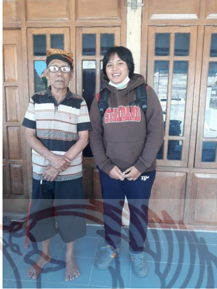
Gambar 15. Dokumentasi pada saat survey pertama kalinya