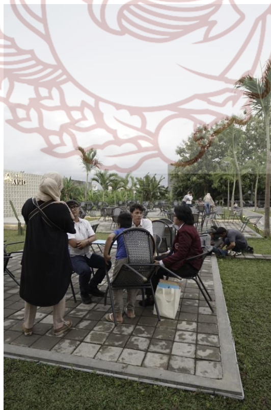
Gambar 18 Dokumentasi pada saat pemberitahuan nilai ujian TA