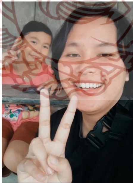
Gambar 16. Dokumentasi pada saat melakukan pendekatan pada Nike