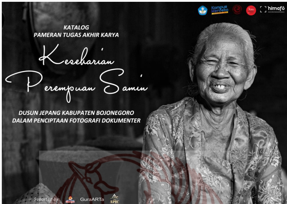
Lampiran 2. Katalog tugas akhir karya