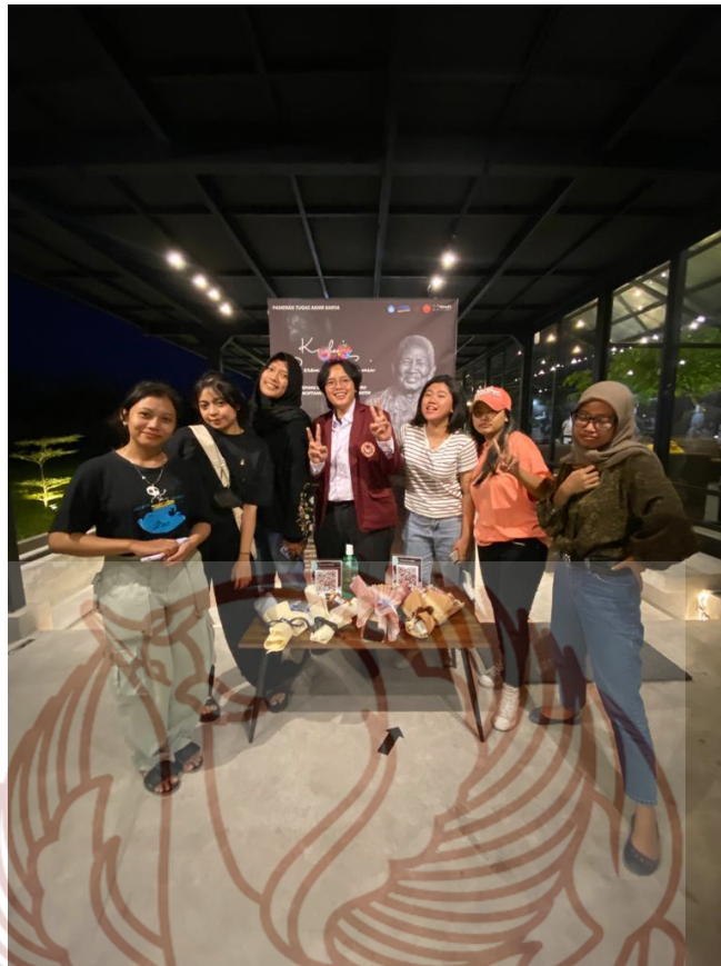
Gambar 19. Dokumentasi bersama teman-teman angkatan 2016