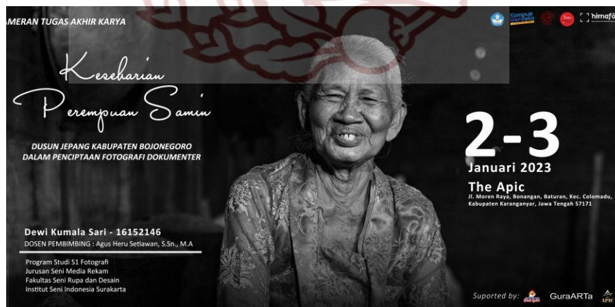
Lampiran 1. Banner pameran tugas akhir karya