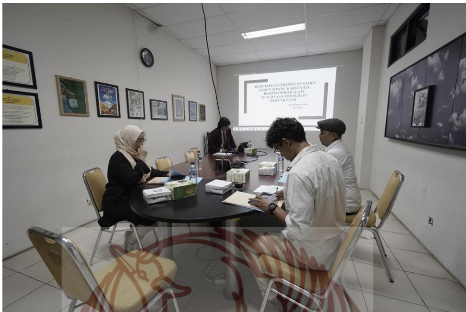
Gambar 17. Dokumentasi saat ujian pendadaran