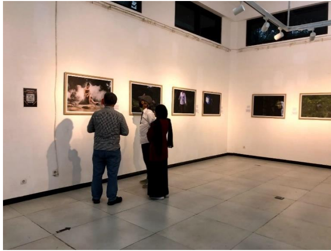
Lampiran 5. Ujian Pendadaran Tugas Akhir (Copy File : Desty Diana Palasari, 2023)