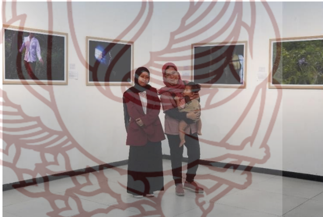
Lampiran 6. Foto bersama Dosen Pembimbing Tugas Akhir