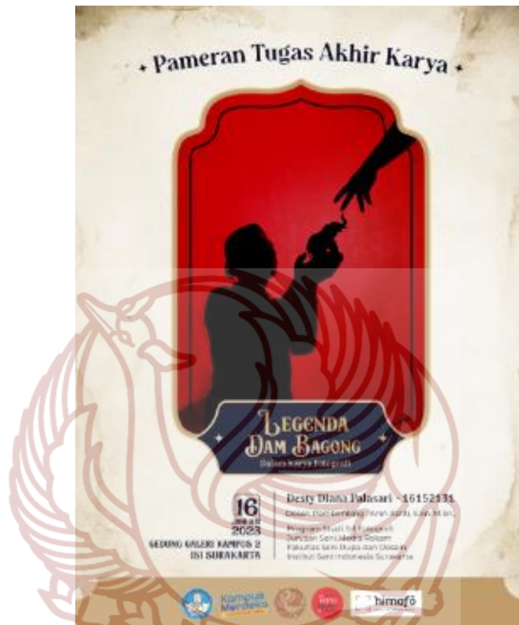
Lampiran 1. Desain Poster Ujian Tugas Akhir (Copy File : Desty Diana Palasari, 2023)