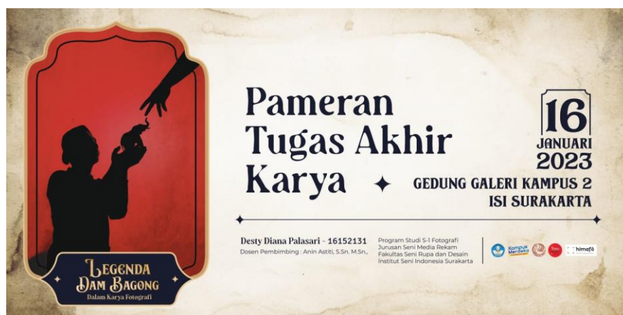
Lampiran 2. Desain Banner Ujian Tugas Akhir (Copy File : Desty Diana Palasari, 2023)