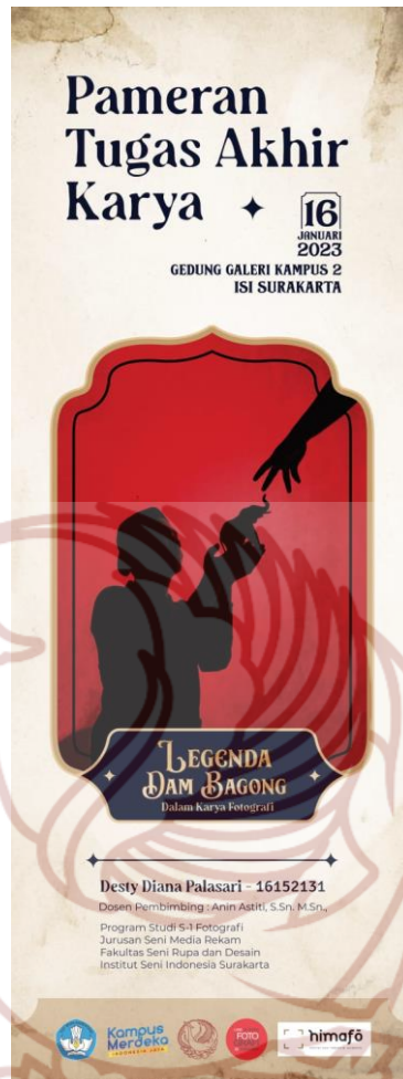
Lampiran 3. Desain XBanner Ujian Tugas Akhir (Copy File : Desty Diana Palasari, 2023)