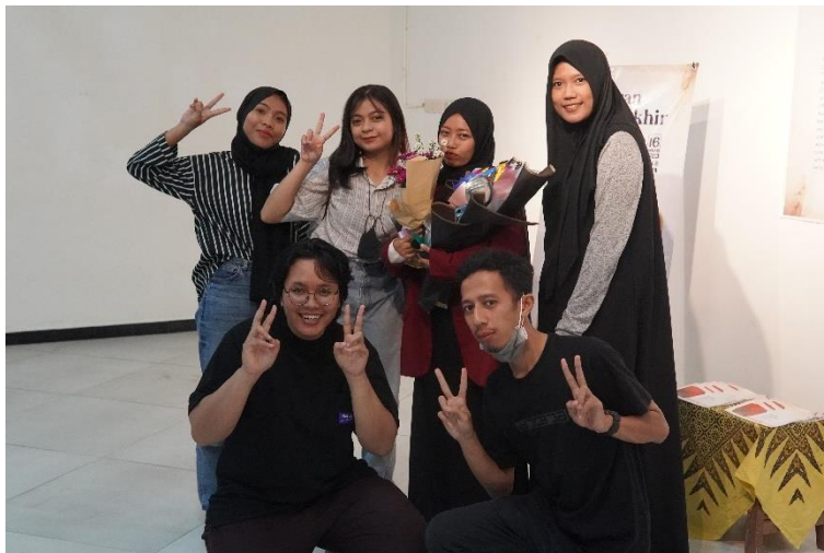
Lampiran 7. Tim Sukses Pameran Tugas Akhir (Copy File : Desty Diana Palasari, 2023)