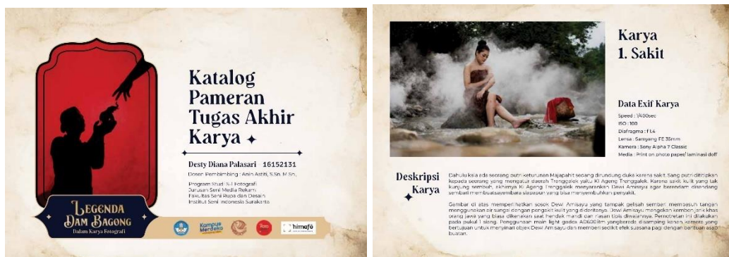
Lampiran 4. Desain Katalog Ujian Tugas Akhir (Copy File : Desty Diana Palasari, 2023)