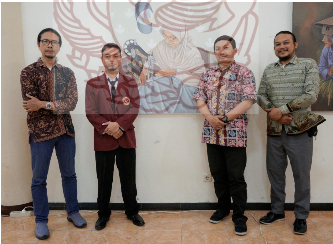
Foto bersama Penguji dan Pembimbing