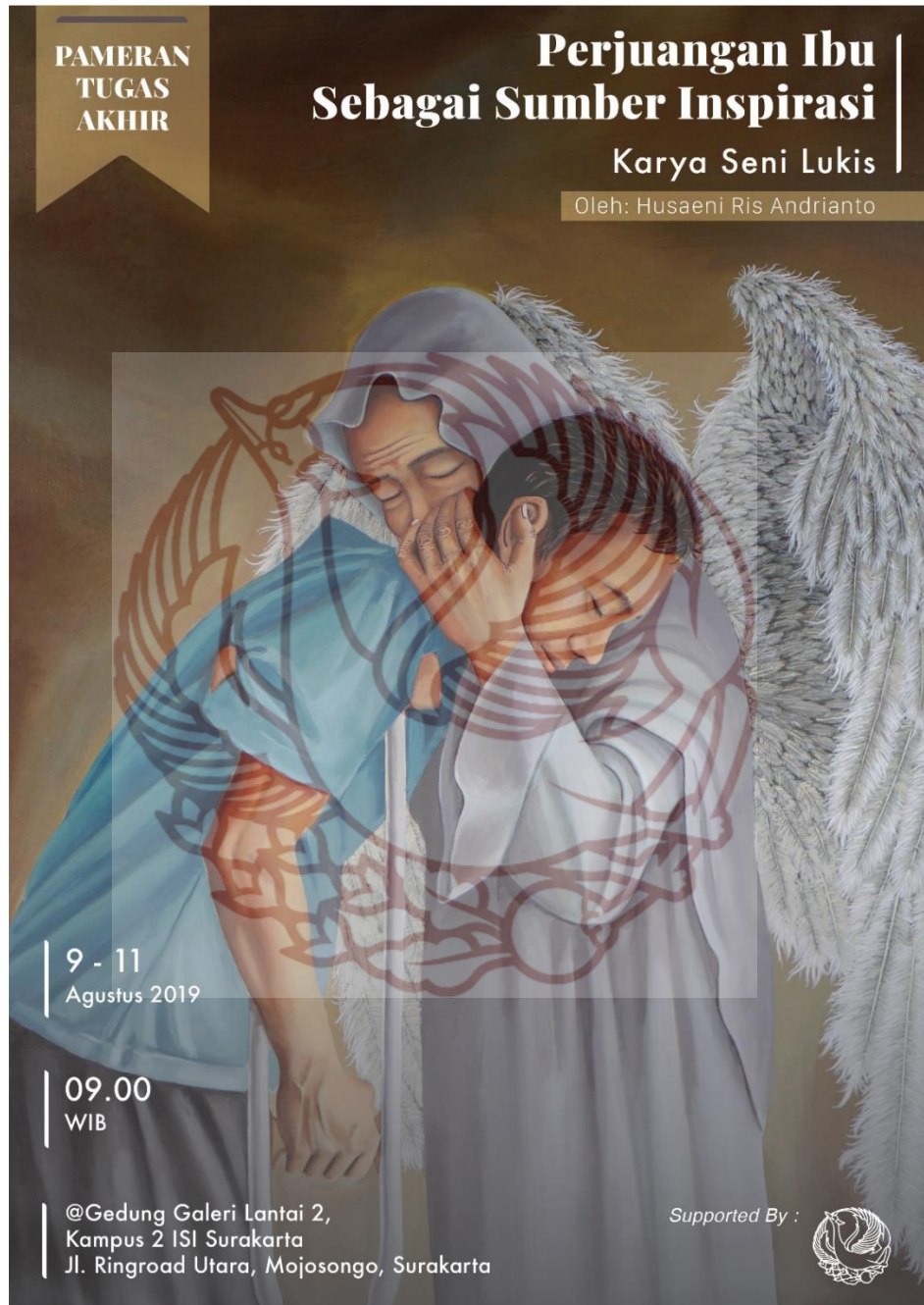
Desain pamflet publikasi pameran Tugas Akhir