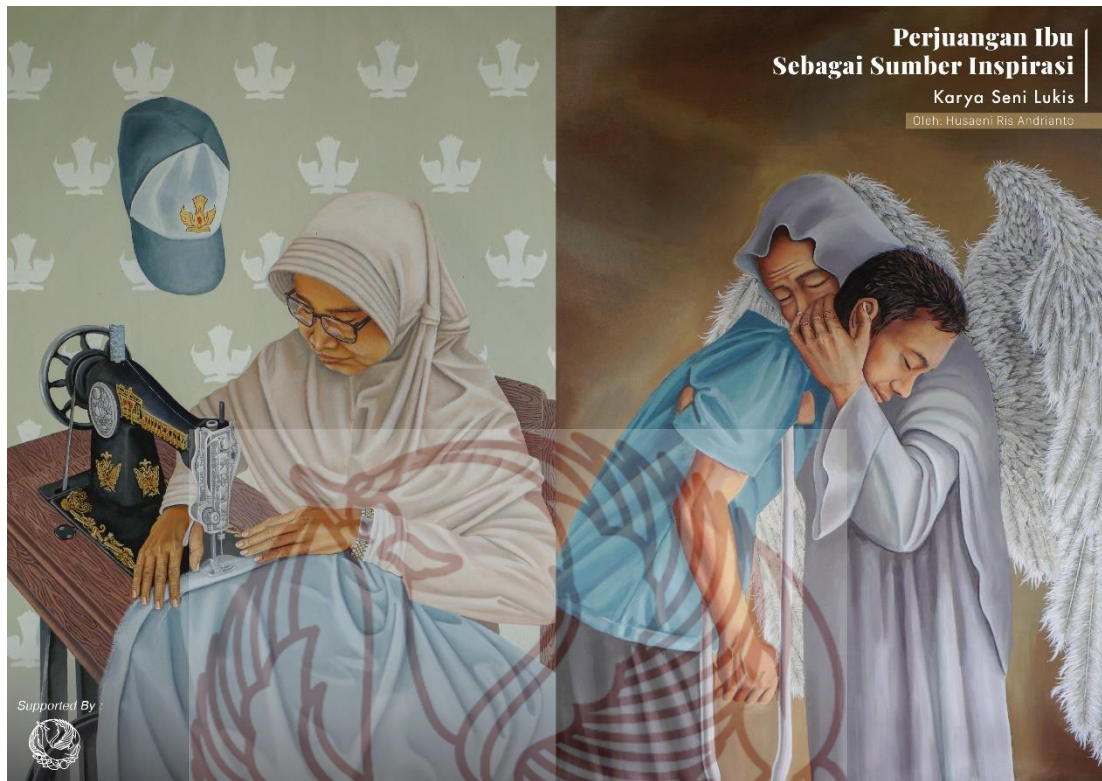
Desain sampul katalog