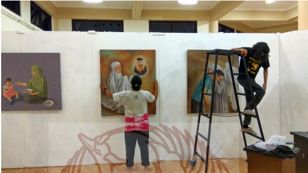
Display karya pameran Tugas Akhir