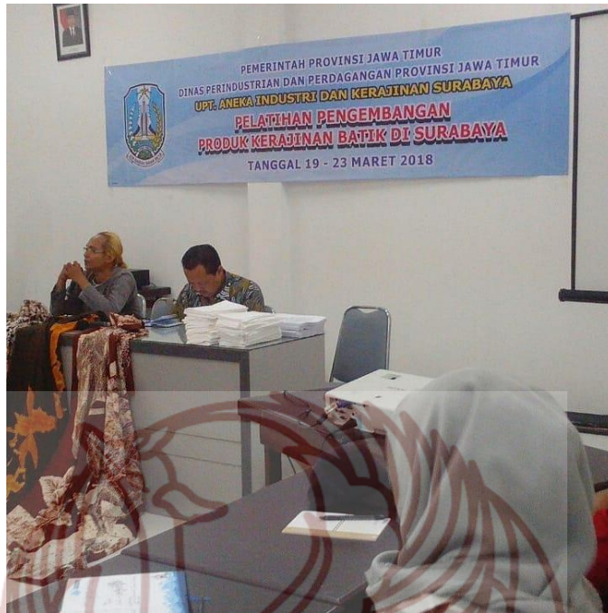
Gambar 3. Acara Workshop Batik di Surabaya (Foto: Ferry Sugeng Santoso, 27 Oktober 2019)