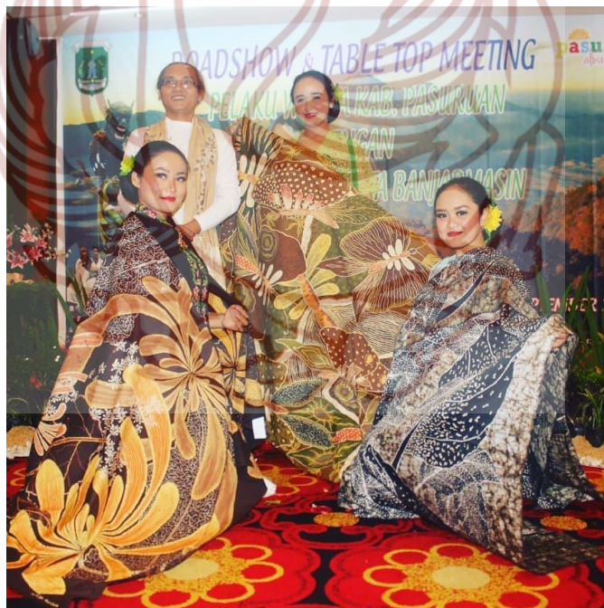
Gambar 2. Acara Fashion show di Pasuruan yang Diadakan Oleh Pemerintah Kabupaten Pasuruan (Foto: Ferry Sugeng Santoso, 27 Oktober 2019)