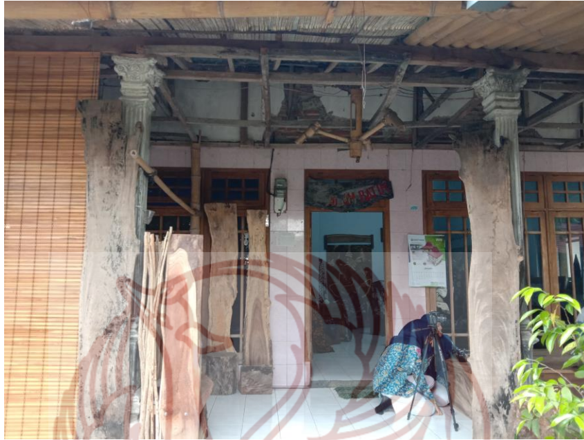
Gambar 7. Tempat Produksi Usaha Ki Joyo (Foto: Halimatus Sa'diyah, 27 Januari 2020)