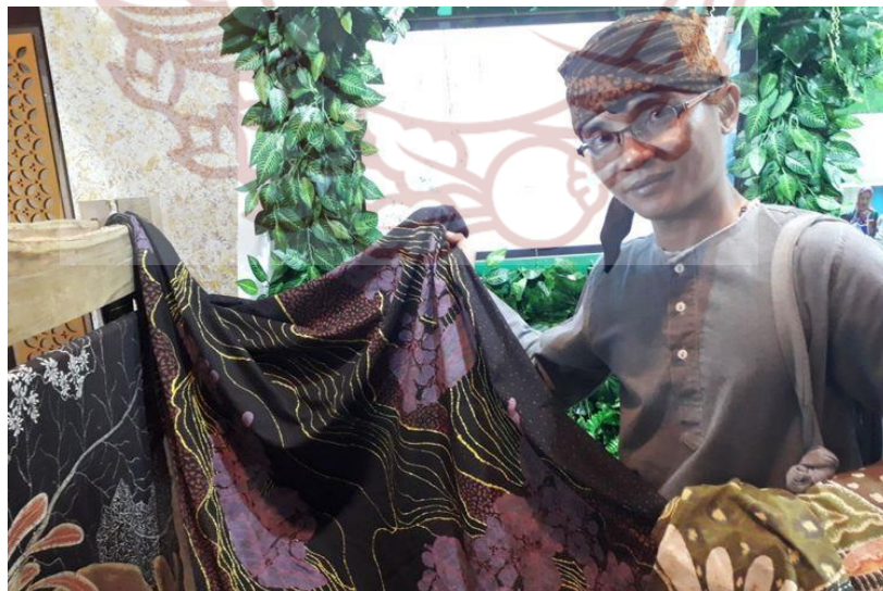
Gambar 4. Figur Ki Joyo Saat Mengikuti Kegiatan Pameran (Foto: Ferry Sugeng Santoso, 27 Oktober 2019)