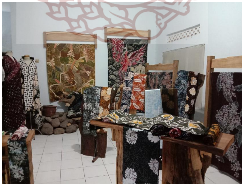
Gambar 6. Showroom Batik Ki Joyo di Pasuruan (Foto: Halimatus Sa'diyah, 27 Januari 2020)