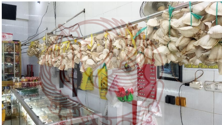
Observasi ke toko Puduk