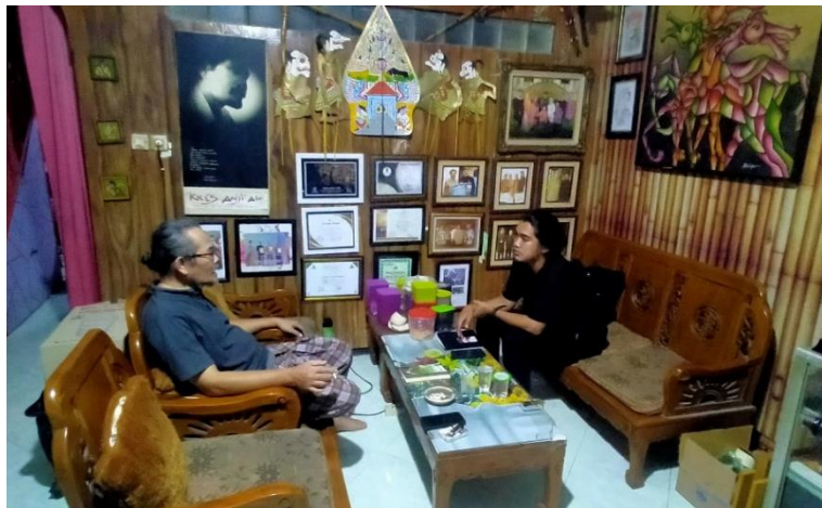
Wawancara dengan Narasumber