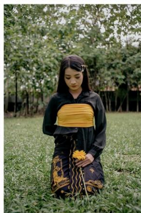
(Deskripsi karya Padmarini pada katalog)