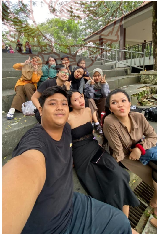
(Crew yang telah membantu dalam proses pemotretan)