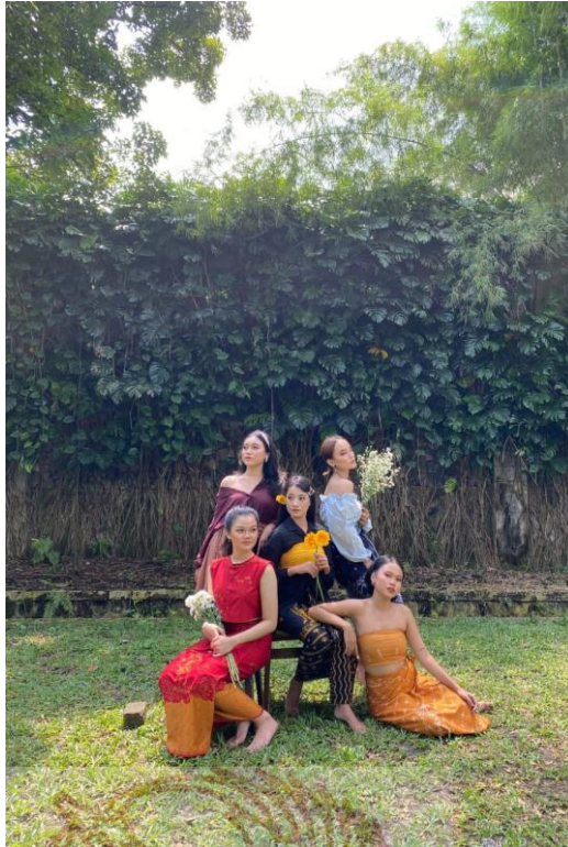
(Proses pemotretan Tugas Akhir)