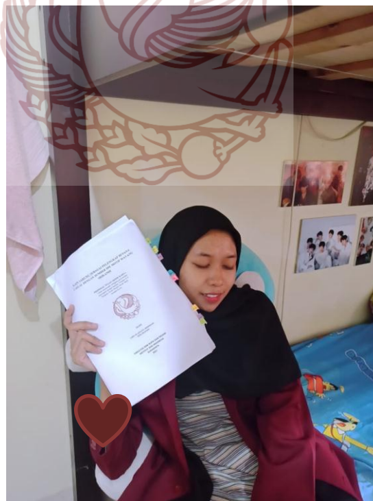
(Ujian Proposal 5 januari 2022)