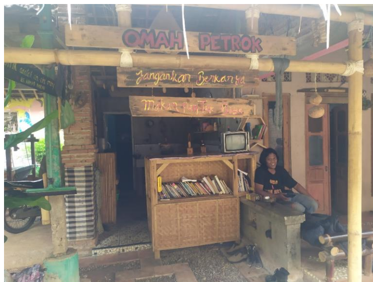
Kunjungan ke Paguyuban Omah Petruk Troso (11 Juni 2019)