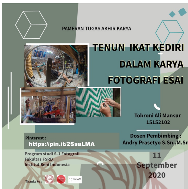
Gambar 17. Poster Pameran