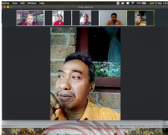
Gambar 19. Foto Ujian Daring