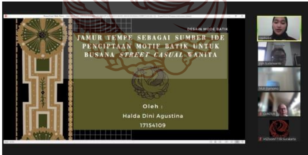
Gambar 81. Ujian Kelayakan Sumber: Halda Dini Agustina 02 Desember 2021