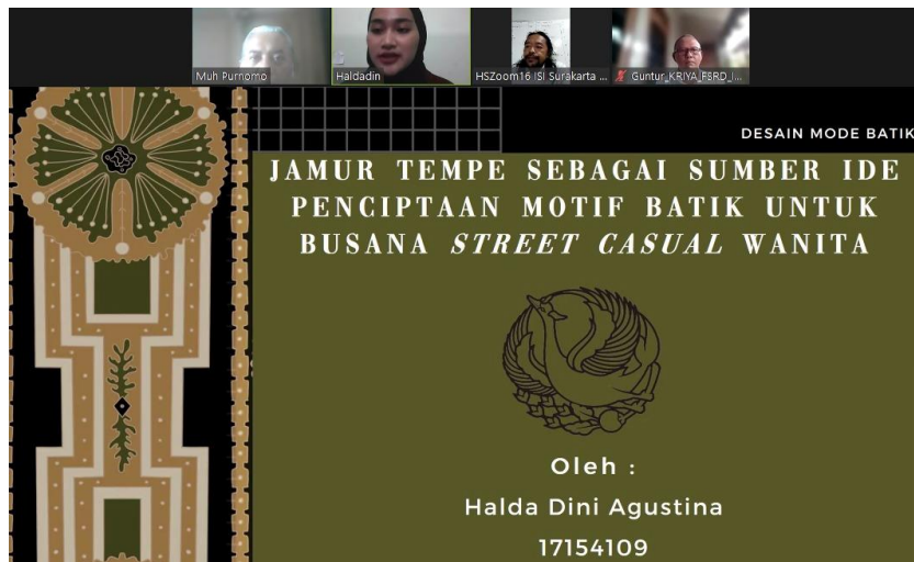
Gambar 82. Ujian Pendadaran

Sumber : Halda Dini Agustina 06 Januari 2020