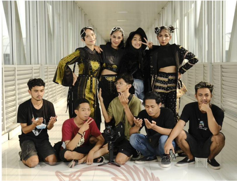
Gambar 80. Photoshoot Tugas Akhir Sumber : Hema Kusuma 23 Oktober 2021