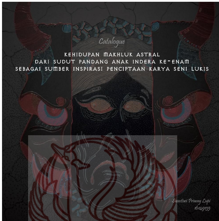
Lampiran 2, Desain Halaman Awal Katalog Pameran Tugas Akhir