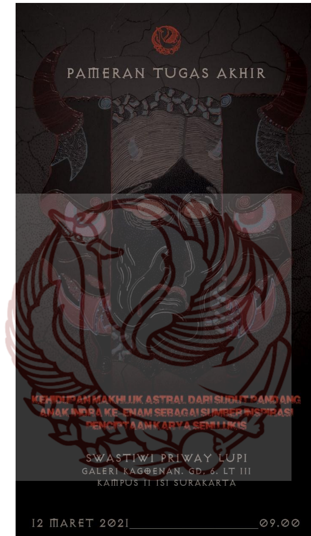
Lampiran 1, Desain Pamphlet Pameran Tugas Akhir (Copy File : Swastiwi Priway Lupi, 2021)