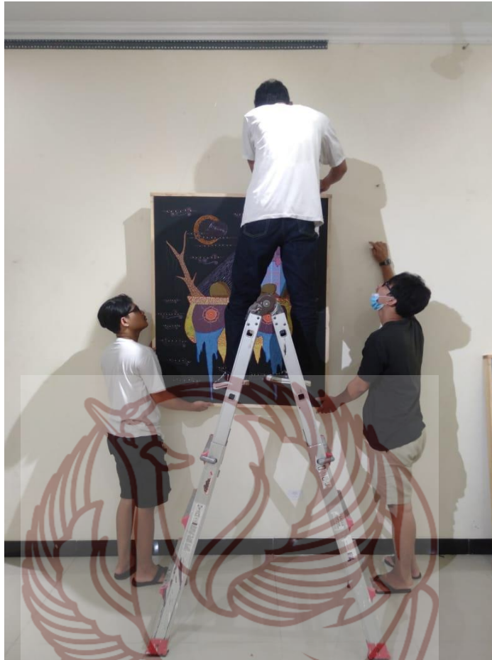
Lampiran 4, Display Pameran Karya Tugas Akhir