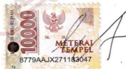
Endah Ayu Prasetyo