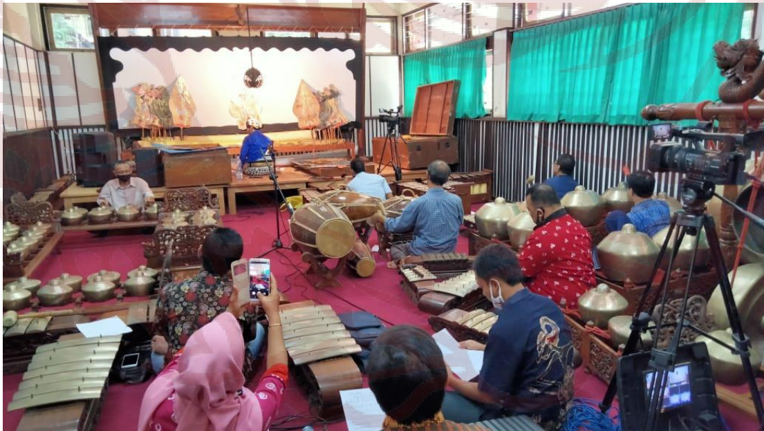
Pelaksanaan Penelitian Artistik