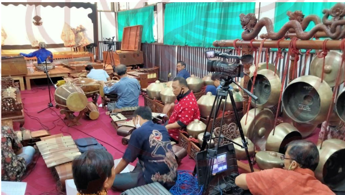
Tim Pengiring dan Video dalam Penelitian Artistik yang dilakukan

Lampiran Foto. Pakeliran Garap Abur-aburan diunggah di channel Anjani Solo dalam bentuk Materi Ajar.