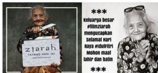
Gambar 4. Latihan pose di depan Kamera

“... Latihannya adalah latihan pose, berbagai macam pose yang tidak biasa dia lakukan didepan kamera dengan kostum dan properti yang tidak biasa dia pakai, posenya unik-unik, posenya lucu-lucu, agar dia bisa tampil jadi lebih PD gitu di depan kamera dan tidak canggung di depan kamera, tapi latihan seperti itu sangat efektif.” (BW Purba Negara, post instagram @filmziarah, 17 Mei 2017).