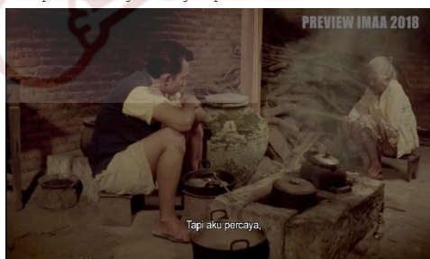
Gambar 8. Potongan naskah dan adegan scene menggunakan metode mem-beo-kan

Dengan suasana produksi yang nyaman, membuat Mbah Ponco selama proses produksi dapat berakting sebagai Mbah Sri dengan sangat bagus, sehingga