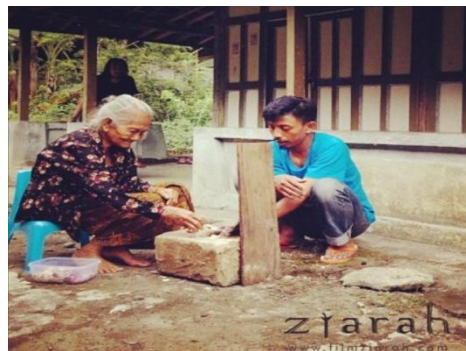
Gambar 3. Proses rehearsal

Rehearsal atau latihan dilakukan dengan cara mengatur tata gerak ( blocking ), mimik, dan bahasa tubuh disesuaikan dengan keinginan sutradara. Asisten sutradara membangun kepercayaan diri dan mood pemain, sehingga pada saat syuting dapat berjalan dengan lancar (Rikrik El Saptaria, 2006:128-129). Proses rehearsal dilakukan sutradara, asisten sutradara, dan Mbah Ponco. Oleh BW Purba Negara, asisten sutradara dibuat sedekat mungkin dengan Mbah Ponco, sehingga benar-benar seperti hubungan seorang nenek dan cucunya. Upaya membangun kedekatan emosional dengan pemain menjadi hal yang sangat penting, sehingga memudahkan ketika mengarahkan akting.