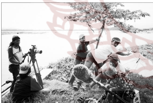
Gambar 9 & 10. Proses Produksi

Sutradara mampu memanipulasi segala keterbatasan dan kekurangan Mbah Ponco Sutyem sebagai pemeran Mbah Sri melalui strategi yang dibangun.