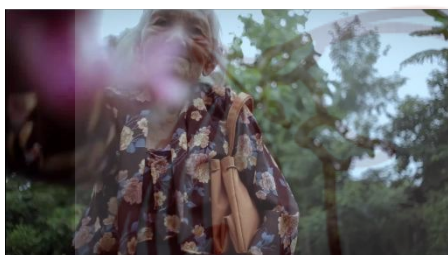
Gambar 5 & 6. Proses rehearsal dan hasilnya digunakan dalam film