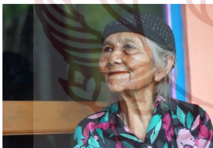
Gambar 2. Calon Pemeran Mbah Sri

Dari hasil wawancara BW Purba Negara (2018), diketahui bahwa sebelum memasuki tahap casting , pihak manajemen membuat dummy untuk mencari founding guna pembiayaan pembuatan film Ziarah . Dalam proses produksi, sutradara menggunakan nenek berusia 80-an tahun untuk direkam. Banyaknya kerutan di wajah nenek tersebut, memberikan sebuah keyakinan bagi sutradara bahwa tokoh Mbah Sri tidak terlalu membutuhkan akting yang ekstra, tetapi cukup dengan bermain ekspresi, dan itu dianggap sudah cukup untuk mengaduk emosi penonton.