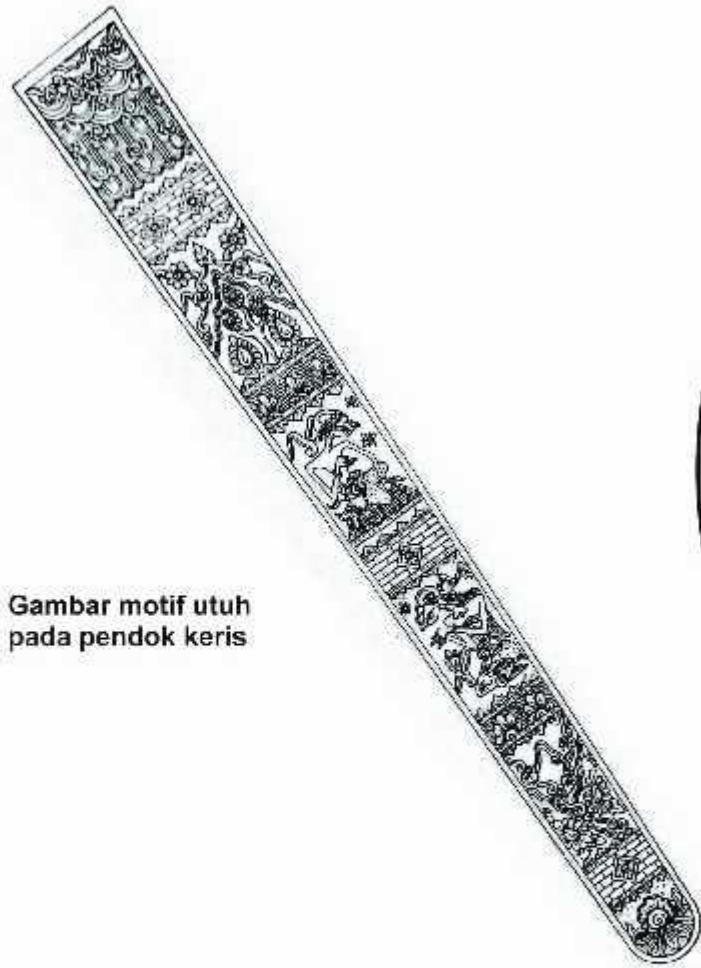
Gambar motif utuh pada pendok keris