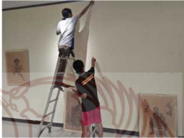
Display karya pameran tugas akhir