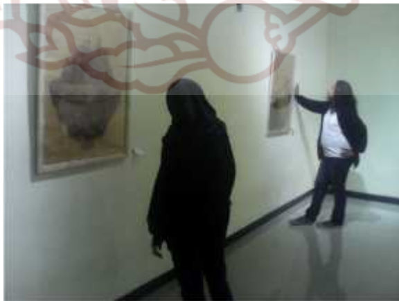
Suasana pameran karya tugas akhir