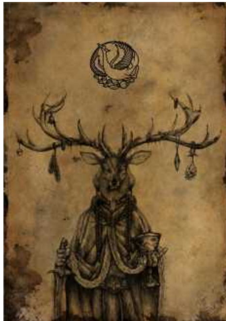
Desain sampul belakang katalog pameran tugas akhir (copy file:usman supardi)