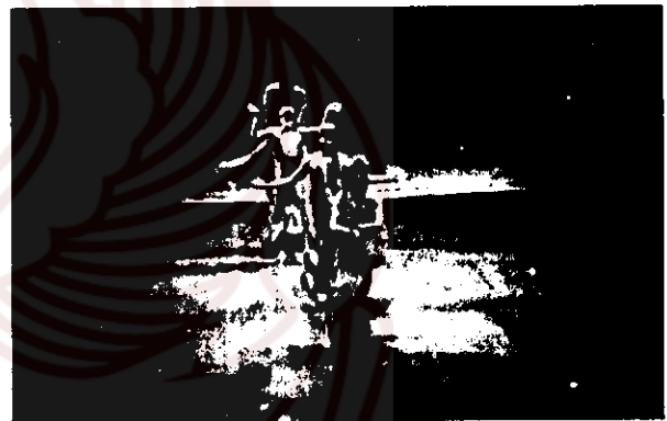
Gambar 3 Gerakan Tari Solah

Sajian pertunjukan Solah tidak berdasarkan pada rangkaian alur cerita, tidak memiliki bentuk adegan, dan tidak memiliki alur dramatik konvensional. Karya ini menjadi sebuah laku impresif para penari yang didasarkan pada intuisi, imajinasi, asumsi, dan interpretasi pada ruang, waktu, dan suasana. Suasana meditatif mewarnai repertoar ini dari awal hingga akhir. Tanpa ada mula, jeda, dan akhir yang jelas. Semua mengalir dalam alur meditatif yang intens. Penegasan suasana, interpretatif, asumsi, dan imajinatif dapat dirasakan lewat kehadiran background yang sengaja untuk memberikan stimulan, sentuhan, dan daya rangsang eksploratif para penari.