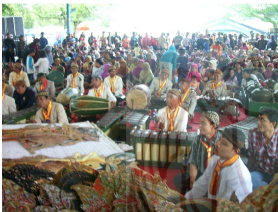
Gambar 3. Pengrawit dan Penonton.

Atas kerperkasaan Werkudara, Karungkala dapat dikalahkan dan badar atau berubah wujud menjadi Lumbung Silajur. Dari ceritera lakon akhirnya terbukti bahwa semua tokoh Pudak Sitegal adalah penjelmaan dari seluruh perlengkapan penyimpanan padi yang menjadi wewenang Dewi Sri dan Sardono. Dengan kembalinya Dewi Sri dan Sardono ke pangkungan Pendawa, Amarta menjadi sejahtera murah sandang dan pangan.