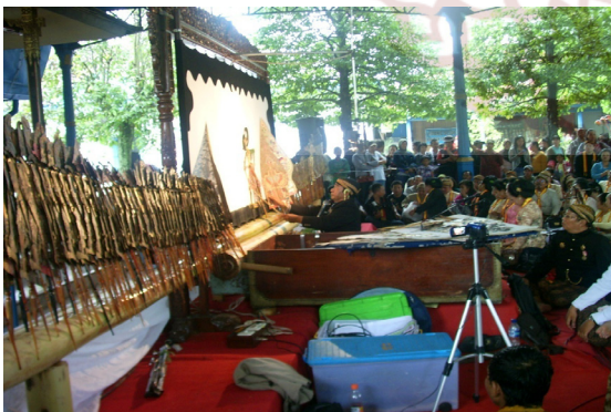
Gambar 2. Werkudara dalam adegan paseban Jaba

Proses islamisasi membutuhkan rentang waktu yang panjang, gradual, dan berhasil terwujud dalam satu tatanan kehidupan masyarakat santri yang saling hidup berdampingan. Akulturasi budaya merupakan ciri utama filsafat Jawa yang menekankan kesatuan, stabilitas, keamanan dan harmoni. Dalam etika kebijaksanaan hidup Jawa, pola hidup berporos pada dua kata kunci yaitu kerukunan dan hormat (Magnis Suseno 2003: 38)